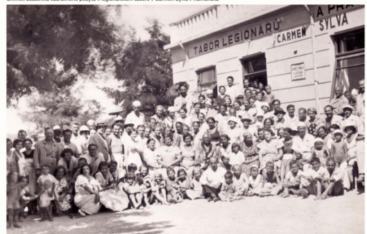
Snímek účastníků ozdravného pobytu v legionářském táboře v Carmen Sylva v Rumunsku