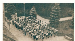
Snímek z nástupu legionářských dětí na rekreačním táboře

V roce v roce 1928 bylo registrováno celkem 10 345 invalidů, z nichž na území státu žilo 9 870 a v zahraničí 225. Pro legionáře, jejichž zdravotní stav byl nejvážnější, byla v letech 1919–1925 určena tzv. útlina legionářů-invalidů, umístěná na záměcku Leontýna u Křivoklátu. Nahradil ji nově zřízená a moderně vybavený Dornov čs. legionářů-invalidů na Jenerále v Šarce, jenž poskytoval přístřeší přibližně pěti desítkám legionářským invalidům. Pro legionáře a jejich rodiny sloužila i celá řada ozdravných a dalších ústavů na území celého Československa, a to nejen sociálních, ale i vzdělávacích a jiných.