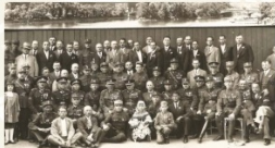
Při sjezdech se mnohdy po letech setkávali spolubojovníci. Na tomto snímku jsou příslušníci 2. a 3. čs. střeleckého pluku ruských legií spolu s generály Sypovym a Kulvaševem.

Smetanově síni Obecního domu v Praze konal koncert České filharmonie za účinkování legionářského virtuosa Josefa Muziky. Slavnostní představení proběhla rovněž v Národním a Stavovském divadle. Dne 30. června se pak konal mohutný manifestační průvod, kterého se účastnilo více než 30 000 členů ČSOL. Ostatně průchod všech skupin průvodu Václavským náměstím trval plných 70 minut. Uspořádáním a bezchybným provedením I. manifestačního sjezdu prokázala ČSOL v třetím roce své existence nejen organizační schopnosti, ale i vnitřní jednotu.