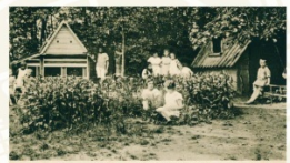
DĚTSKÁ ODDĚL, CHAJKOVSKÝ