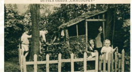
Dětské hřiště pro děti legionářů v ozdravně v Krmu u Mladé Boleslavi

Řada představitelů nového československého státu chápala odpovědnost, kterou má republika vůči čs. legionářům. Vznik Československa by nebyl možný právě bez jejich odhodlaní vstoupit do boje za samostatnost vlasti. V prvních letech vzniklo několik zákonů, které měly legionářům usnadnit hledání zaměstnání. Válkou vyčerpaná ekonomika však nebyla schopna rychle pojmut desetitisíce legionářů, navracející se ze Sibiře v průběhu roku 1920. Výsledkem byl fakt, že až 15 000 legionářů po svém návratu nebylo schopno nalézt práci.