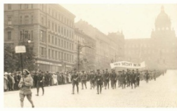
Při I. manifestačním sjezdu se prezentovaly i jednotlivé župy, v tomto případě Mladoboleslavská župa ČSOL.