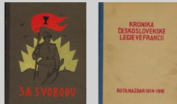
Za příspění Historického sboru při ČSOL, usilky i měšerá dily rozličných publikací a t. z. legií v Rusku

Vydávání Národního osvobození si vyžádalo rovněž zakoupení tiskárny, která ČSOL vyšla celkem na 1 500 000 Kč a do které bylo nutno následně investovat téměř stejnou výši finančních prostředků na nákup modernějších strojů, mimo jiné rotačky a dvou amerických sázečích strojů. Tiskárna se zapsala do povědomí pod názvem Pokrok. Jejím úkolem však nebylo pouze vydávání Národního osvobození, jehož produkci tiskárna zveřejnila, ale tiskla i materiály a publikace ČSOL obecně.