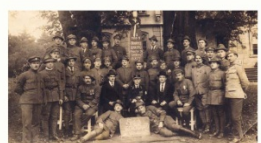
Posluchači obchodní školy pro legionáře ve Studenci u Nového Jičína