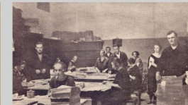
Expedice knihotiskárny Pokrok

Zatímco týdeník svůj název změnil na Legionářskou stráž, pod názvem Moravský legionář vycházela ediční řada brožur, která přibližovala životní osudy výjimečných osobností národních dějin a prvního odboje, ale také dějinné události či současné sociální otázky. Počty vydaných titulů bylo třeba brzy počítat na stovky.