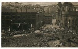
Cílem praporečnických manifestačních sjezdů byla pražské Staroměstské náměstí, kde se nacházela tribuna se slavnostními hosty

Na začátku července 1935 byl konán III. manifestační sjezd, který se v počtu účastníků vyrovnal tomu předchozímu. Konání dalšího sjezdu překazila druhá světová válka, a tak bylo možné uspořádat IV. manifestační sjezd až po jejím skončení v roce 1947. Sjezdy, který byl na dlouhá léta posledním, se však již nedožila řada členů ČSOL, kteří položili své životy ve svém druhém boji za svobodu své vlasti.