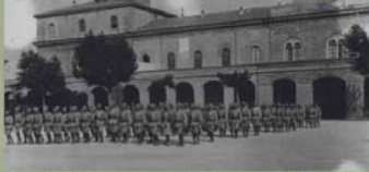
Skupina příslušníků 23. čs. střílečského pluku při výcviku v pracovních stápnkách