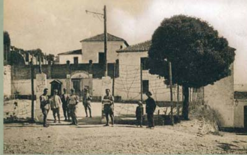
Každina v Capricci, v noci byli soustředěni zajatci české dialektiky