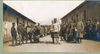
Rozdávání obilný v zajateckém táboře v Padule