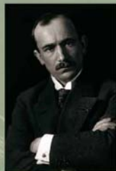
Eduard Beneš (1884–1948)

Filozof a sociolog, politik a státník. Po vypuknutí I. světové války stál v zrodu domácího odboje. V ústředí i 1918 odjel do zahraničí, aby svým vlivem získal pñedstavitelství Dohody pro národnost-nevlastnický program Čechů a Slováků. Spolu s E. Benešem a M. R. Štefánikem se podílel na dohodových jednáních. V letech 1916–1918 byl předsedou čs. národnostní jednoty. Významně se podílel i v vytvoření čs. legie v Rusku ve Francii a v Itálii. V listopadu 1918 zvolen prvním prezidentem CSK.