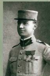
Poručík francouzského letectva M. R. Štefánik