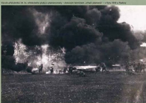
Výcvik příslušníků 24. čs. střílečského pluku s plynomety – důbovým termem „vrhání plynové“ – v říjnu 1918 u Padovy