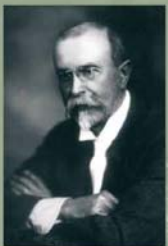
Tomáš Garrigue Masaryk (1850–1937)

Slovenský astronom, diplomat, politik a vojenský čínělný generál francouzské armády. Píve velká zřetavná úloha vstoupil po vypuknutí I. světové války dobrovolně do francouzské armády. Významné splnění své diplomatické schopnosti a styky s vládními francouzskými a italskými politiky. V letech 1916–1918 se významně podílel na vytvoření čs. legie v Rusku, Francii a Itálii. Zastával funkce i mezi ústra vojensku v poziciích čs. vlády v Paříži a v první vládě CSK. Při nárazu do vlasti zahájil dne 4. 5. 1919 při letáckém neštěstí v Bratislavě.