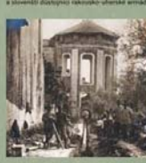
Ze žvota zajatců v táboře Padule