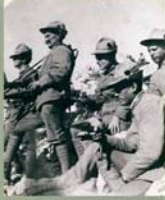
Oddíl samopalů – důbovým termem „automatických zbraní“ – II. roty II. praporu 31. čs. střílečského pluku

Po dokončení výcviku se divize přesunula do příhranového pásma v okolí města Orgiana jižně od Vicenzy. Ve Folgornu zůstalo náhradní těleso, do něhož byli přimánováni noví dobrovolníci ze zajateckých táborů, především z Forte d'Amone u Sulmony či Avezzana, ale i z Albano, kam se dostali jedná z bojích v létě 1918, jednak tam byli dopravováni ze Sicílie na práce. Proto mohl být na podzim 1918 postaven 25. čs. střílečský pluk.