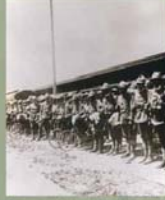
Skupina zvláštní I. praporu 25. čs. střílečského pluku v Folgornu 3. července 1918