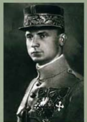
Milan Rastislav Štefánik (1880–1919)

Československá armáda se zrodila dříve než Československý stát a existence čs. legie byla nepopíratelným argumentem pro mezinárodní politické uznání práva Čechů a Slováků na samostatnost.