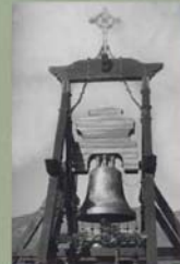
Zvon padlých v Roveretu