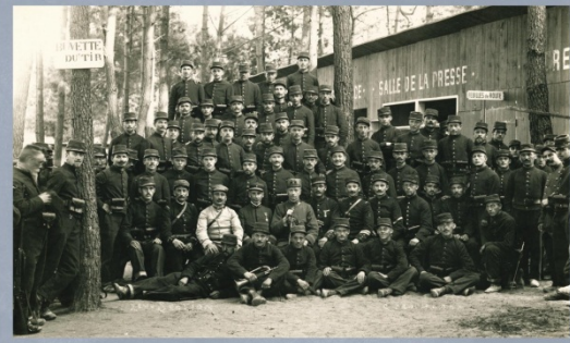
2. Rota „Nazdar“ těsně po obdržení francouzských stejnokrojů. Dobrovolníci ještě nemají na čepicích náleže hroší granáty.

roku 1916, kdy byl plátně nahrazen praktičtějším stejnokrojem hnědé barvy. Kalhoty / Pantalón modřil 1893 / V poli se používaly používáno různých pleševkových kalhot a kalhoty civilního původu, protože výrazná červená barva se pro podmínky moderního boje příliš nehodila. Přesto byly používány ještě na jaře roku 1915. Základ výstroje tvořil řemení a munice pro pušku Lebel. Skládala se z opasku a pomocných řemenů tvaru Y modřile 1892, sloužících k lepšímu rozložení hmotnosti nábojových sumáků modřil 1905. Na opasku je na leve straně zavěšen bodák k pušce Lebel modřile 1898. Vedlejší kůlně výstrojí součástí byly na počátku války lakované na černo. Pod opaskem je flanelový pás modřil barvy, který se u cizinecké legie používal jednak pro pohodlnější nošení výstroje a pak pro ochrání stáde teplejší organy. Nošení přes plát se používalo pouze pro předhližkové úbočí. Mošna / Mousette modřil 1902 / Zavěšená na levém boku, obsahovala dávku potravin, tabák, jídelní a osobní předměty. Pelát láhev / Bouteil d'un litre modřil 1877 / Litrová lahev s čtvrtlitrovým šálkem byla zavěšena k pravému boku. Na zádech má výška torba / Maresac modřil 1895 / s vakem pro výstroj potřebnou pro život v poli.