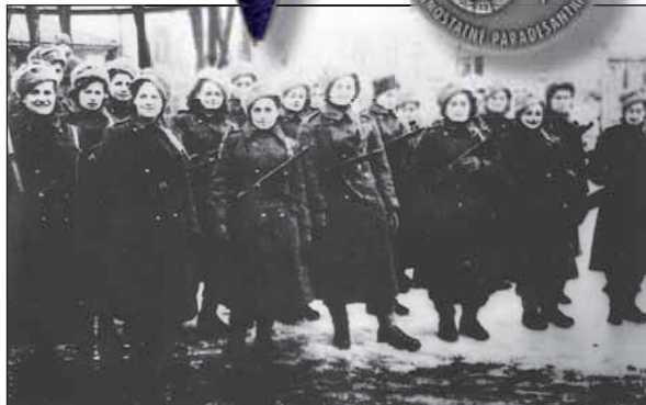
Přísaha v Jefremově v únoru 1944