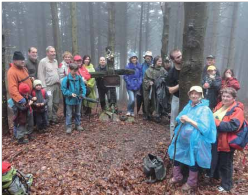
Ani déšť nepřekazil výstup ke kříži s převýšením více než 500 m