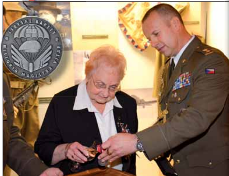
Křest pamětního odznaku vydaného Občanským sdružením ČERVENÉ BARETY

Maminku propustili z nemocnice, padáky byly předány, a tak jsme se vypravily za našim vojskem přes Dukelský průsmyk. Otec mi při loučení dal pistoli, abych se mohla – kdyby něco – bránit. S plnou polní jsme šly pěšky, vezly se na saních, občas nás vzali autem Sověti. Bylo 8. ledna 1945, když jsme procházely dukelským bojištěm. Všude plno zničené techniky, plno munice, trosek, mrtvých koní. Jen padlí byli pohřbeni. Byli jsme poučeny, že za žádnou cenu nesmíme opustit bezpečnou silnici, všude číhaly zákeřné miny. Dne 6. října 1944 překročila čs. armáda v průsmyku československo-polskou hranici a vztyčila tam sloup se státním znakem. Stály jsme u něj a plakaly štěstím, protože jsme byly DOMA! V Nižném Komárniku jsme přespaly u dobrých lidí na slámě. V domě byl smutek – mladý hoch šlápl v lese na minu.