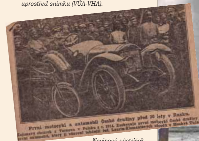
Novinový výstřížek z roku 1934