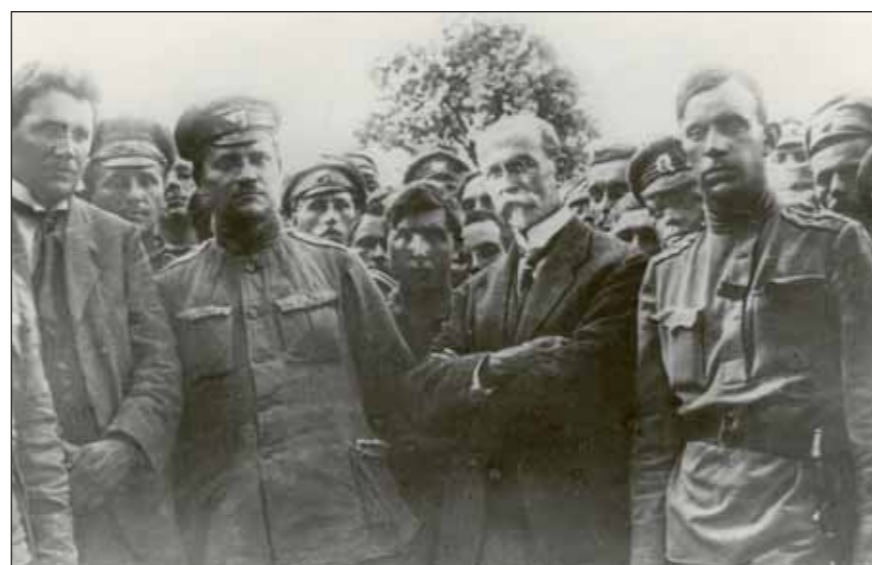
TGM u 1. čs. náhradního pluku v Rusku v roce 1917

Na to reagoval poslanec T. G. Masaryk, který prohlásil: „Obyčejní lidé bojují a my politici neděláme nic.“ Rozhodl se odejít do zahraničí a odtud organizoval protirakouský odboj. Před odchodem projednal plány se starostou