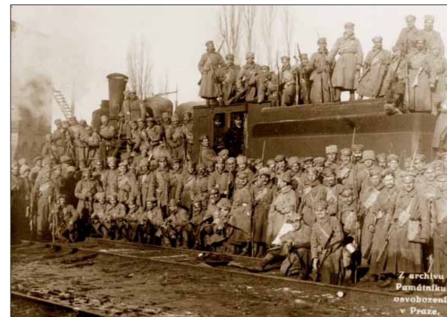
Část 6. pluku před nasazením do bojů. Zatímco jednotky 6. a 7. pluku bojem zdržovaly nastupující Němce, podařilo se přepravit pluky I. divize přes Bachmač na východ.

Na severním úseku docházelo během dne jen k dílčím přestřelkám s jednotkami nepřítele a srážkám malých průzkumných hlídek. V Česnokovce vyměnily v obraně dvě rotu 4. pluku dvě rotu 7. pluku, které byly s oddílem sapérů 6. pluku staženy pod velením škpt. Jungra do zálohy (velení převzal por. Homola ze 6. pluku). Jinak byl na úseku celkem klid, ale byly zpozorovány přípravy nepřítele.