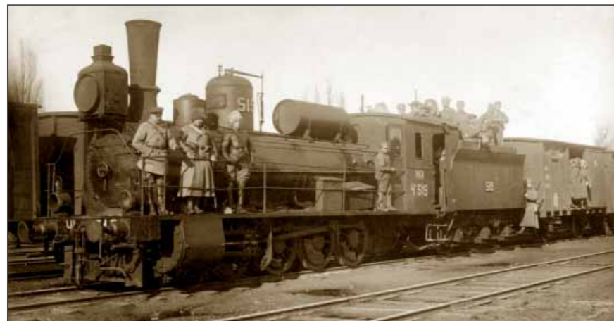
První výprava rozvědky 6. pluku proti Němcům ke stanici Kruty směrem na západ. Nádraží Bachmač-libavské.