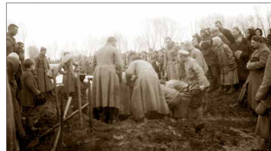
Pohřeb tří příslušníků 6. pluku, kteří zemřeli v místní nemocnici na následky zranění utrpěné v bitvě u Bachmače. Kursk, 16. března 1918.