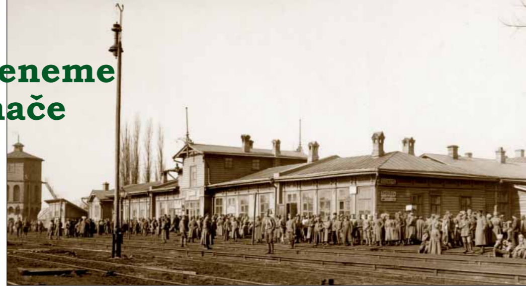
Nádraží Bachmač-libavské po příjezdu prvních čs. jednotek. Poklidná atmosféra je jen zdánlivá - již byly vyslány silné hlídky na sever i na západ, odkud se očekával nápor Němců.

Němci začali postupovat od Gomelu na Bachmač a 6. 3. obsadili stanici Snovskaja. Jako reakci na to III. prapor 6. pluku vyslal zákopnický oddíl pod velením prap. Janouška k obsazení železničního mostu přes řeku Děsnu, který měl být zničen v případě dalšího postupu nepřítele. Následně 7. 3. byl Janouškův oddíl ještě posílen o rotu a kulometné oddíly 7. stří. pluku a velení této představené skupiny ve směru na Gomel převzal škpt. Junger. Nepřítel dále obsadil Nizkovku a přiblížil se k Bachmači. Jungrova skupina zjistila ze zpráv od ruských železničářů, že tyto od Gomelu postupující německé jednotky mají značnou přesilu (jednalo se o německou 224. pěší divizi). Následně se tato skupina stáhla do stanice Makošina, kde měla zničit most přes řeku Děsnu. Tento záměr však sabotovali bolševici - považovali to za ničení národního majetku. Nakonec na místě bylo zjištěno, že ke zničení