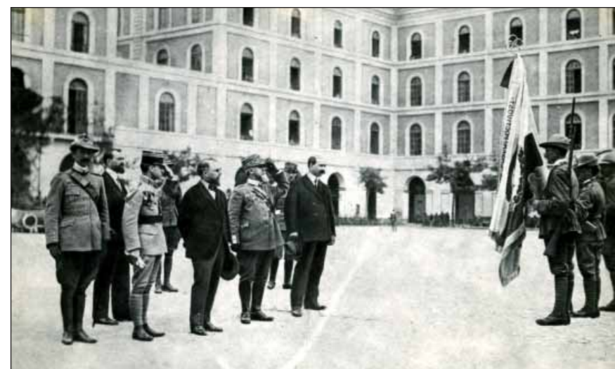
Slavnostní přehlídka 1. praporu 34. pluku před M. R. Štefánikem, americkými, francouzskými a italskými hodnostáři v kasárnách „Knížete Savojského“ v květnu 1918