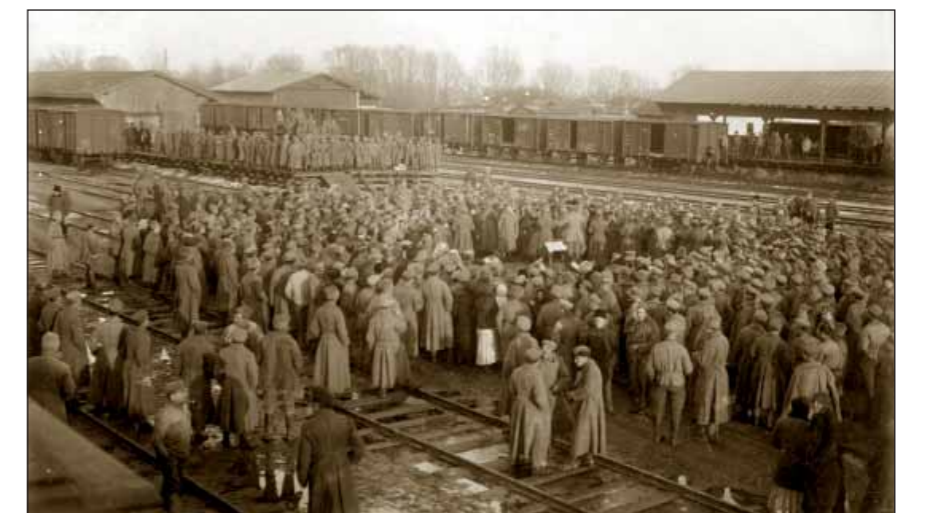
Koncert hudby 6. pluku na nádraží Bachmač-libavské u příležitosti oslav narozenin prof. Masaryka, 7. března 1918.

Tehdy však Mězlův oddíl dorazila posila dvou rot 6. stří. pluku, s nimiž přišla bojovat s Němci i bolševická dělostřelecká četa (složená z Rusů). Taktó posílena zahájila skupina znovu odhodlaný protiútok a německé jednotky opět ze stanice Peski vytlačila a stanici i s vesnicí obsadila. Nepřítel následně soustředil své síly v úseku k dalšímu útoku na Peski. Mezitím však Čechoslováci stanici opustili a stáhli se za ní. V 15 hodin Němci zaútočili a stanici Peski rychle obsadili - opuštěnou. Tím se Němci přiblížili asi na 2 km od trati Bachmač - Ična, čímž vznikalo nebezpečí ohrožení přesunu vlaků I. čs. divize po této trati do Bachmače, který se očekával každou chvíli. Pod dojmem klamného obchvatu čs. jednotek se však Němci, kterým vázl přísun dalších posil, následně ze stanice Peski opět stáhli. Dorazila další posila - III. prapor 6. pluku se štábním kpt. Krejčím, který převzal velení skupiny. To již kolem 16. hodiny po trati z Ičny k Bachmači přijížděly tři prapory