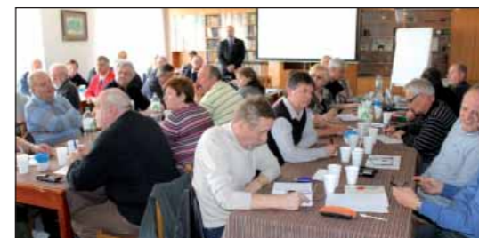
A to jsou ti, kteří péči o válečné veterány naplňují každodenní obětavou prací – krajský koordinátoři a terénní pracovníci. Tentokrát na dubnové poradě v hotelu Legie v Praze.