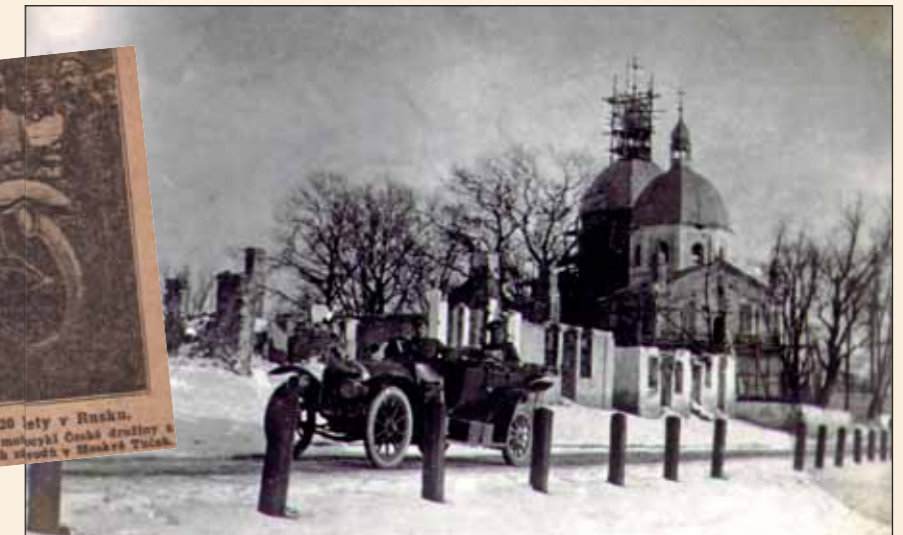
Automobil Laurin & Klement České družiny v Haliči, v zimě 1914/1915