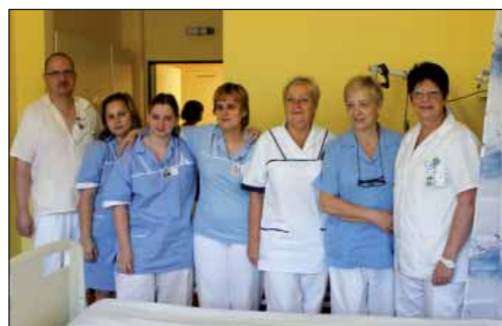
A to jsou ti, kteří s o zájemce preventivního vyšetření po celou dobu jejich pobytu starají.