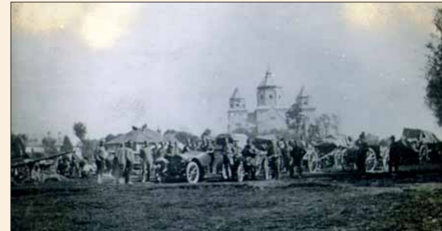
Odchod České družiny na frontu v Haliči v roce 1914. Automobil Laurin & Klement je uprostřed snímku.