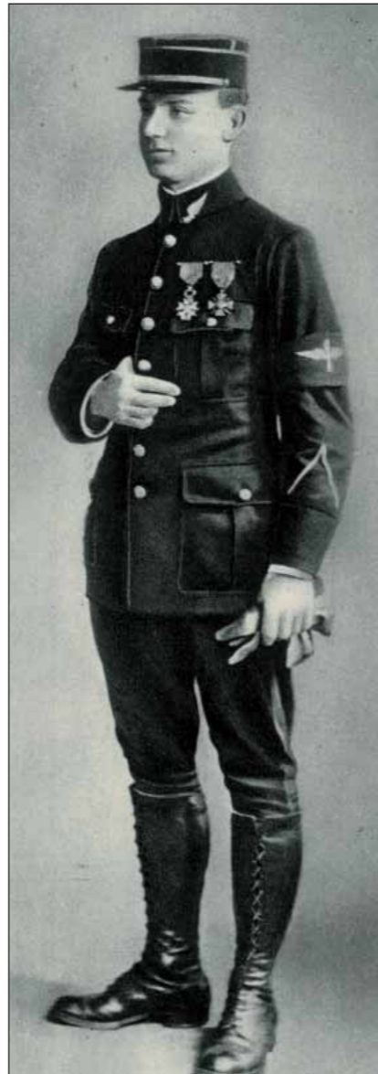
Podporučík M. R. Štefánik v letecké uniformě, 1916

Stovežatá a krásna Praha, v ktorej sa snúbi história a súčasnosť, slovanské mesto opradené legendami, mesto bratov... Tam chce nabrat nové poznatky a naplniť časú ducha vedomostí. Na konci leta 1898 odchádza na vysokoškolské štúdiá na katedre pozemného staviteľstva Stavebnej fakulty ČVUT. Okrem štúdia pracuje v krúžku slovenských študentov Detvan. Bol to kus domova a s ním spojené nové priateľstvá