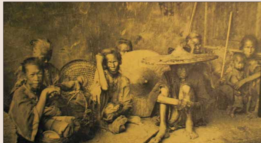
Chinatown Heritage Centre je muzeum v Čínské čtvrti.

„Zamířili jsme do loděnic k nejbližšímu japonskému přístavu, což byla Curuga na severním cípu ostrova Nipon. Japonci nás hned vítali, protože byli proti bolševikům. A tak jsme tam měsíc čekali, než dají lodě do pořádku. Užívali jsme si leg-race, akorát s jídlem nás vždycky napáli. Zdálo se, že na talíři jsou makaróny, tak jsme si je dali, a zatím to byly nařtované žízaly. Nebo jsme mysleli, že kupujeme mandlové koláčky, a když to člověk ochutnal, byly to nějaké rozemleté krovky z chroustů. Jenže ještě horší to bylo, když jsme se zase nalodovali. Tahali jsme do lodí na zádech spoustu uhlí. Mělo se prodávat v Šanghaji, kde jsme potřebovali z peněz za uhlí koupit porcelán, který jsme zase měli prodávat v Singapuru, abychom se uživil. Také jsme byli po cestě asi desetkrát v ohrožení, že se potopíme, ale nakonec se nám přece jen poštěstilo s těmi hrnci a porculánem doplnout do Strait Settlements.“