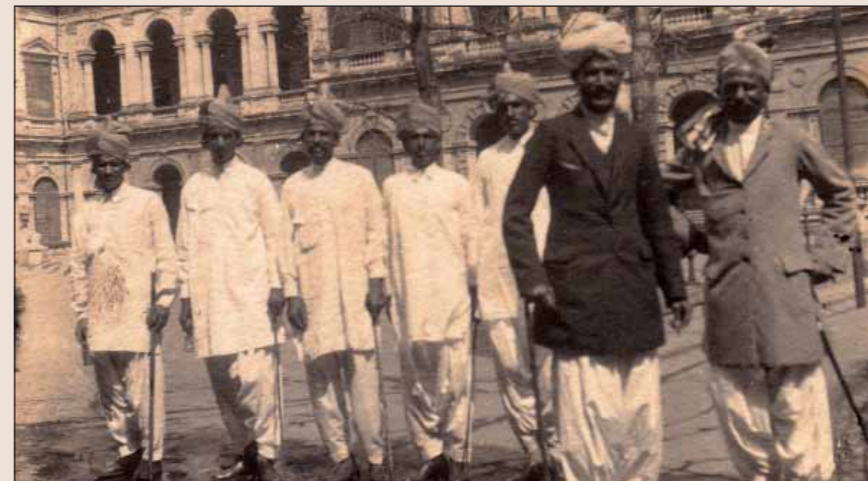
Hotel Raffles v roce 1920, jak jej vyfotil děda Jaromír.