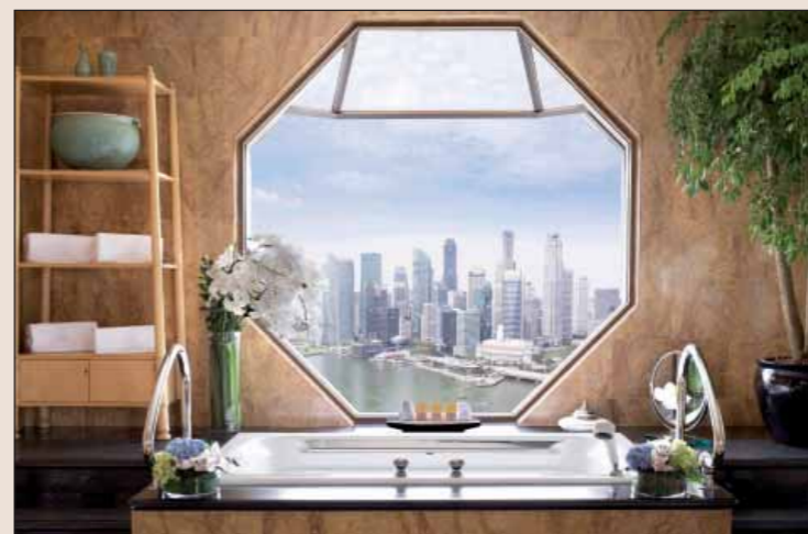
Hotelová koupelna v Ritz-Carlton