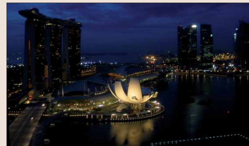
Marina Bay Sands v noci