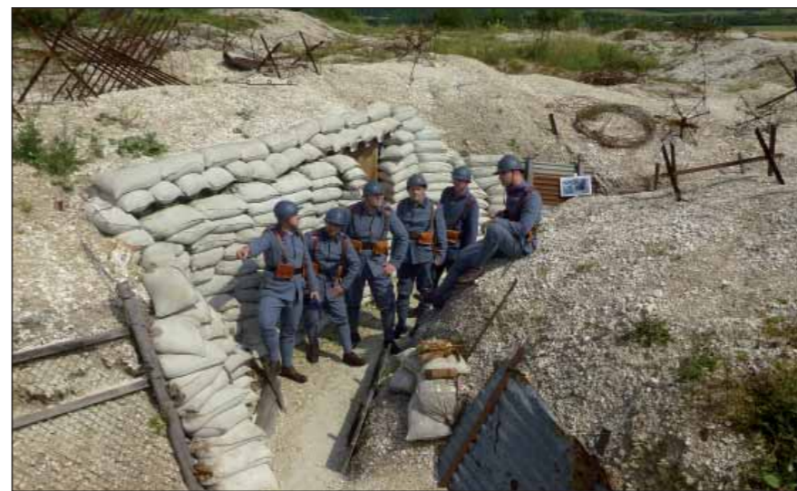
Autenticky vyhlížející snímek v jednom z muzeí pod širým nebem

Dalším pietním zastavením se stal mezinárodní vojenský hřbitov v Minaucourtu [minokur], rovněž jedno z početných míst posledního odpočinku našich krajanů padlých ve Francii. Další pietní akt se konal u kostnice Haute Chavauchée [ot šavoše] v lese nedaleko městečka Varennes-en-Argonne. Památník, vystavěný přímo u kráteru pod jedním z podzemních odstřelů, nese krom jiného i nápis „Československo – I. čs. střelecká brigáda“ doplněný sdruženým znakem čtyř československých zemí. Následoval pietní akt na hřbitově u Chesters [šestr], kde jsou pohřbeni další příslušníci 21. a 22. čs. stří. pluku, kteří zemřeli v první světové válce. Na československém památníku se nachází pamětní deska Ministerstva národní obrany věnovaná vzpomínce na padlé v září 1924 ministrem Udržalem. Na kraji Chesters se nachází krásná socha útočícího čs. legionáře z 22. čs. stří. pluku v nadživotní velikosti z bílého kamene. Památník odkazuje na útok, jenž byl z těchto míst veden na kótu 153, která se nachází na vyvýšenině východně od Chestersu. Po čestné strážu u tohoto pomníku byla právě prohlídka kóty 153 dalším bodem programu, byť vzhledem k parnu a hůře přístupnému terénu bylo její prohlédnutí věci dobrovolnou. Okolí kóty je dnes zemědělsky obděláváno, meze jsou i díky tomu plně vyoraného vojenského materiálu, nechybí ani nikdy nerozmotaná klubka rezavého ostnatého drátu. Stejně zajímavým se stalo i projití vesnice Terron