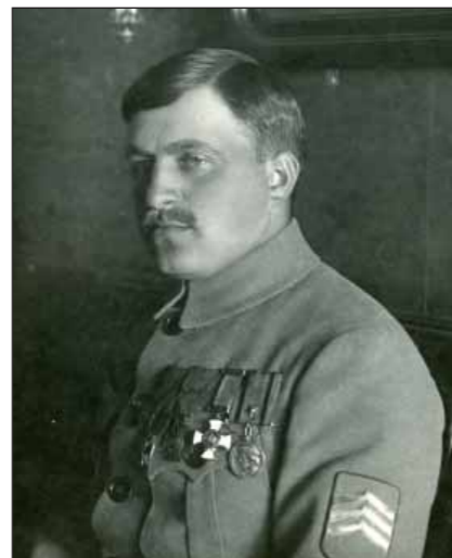
Plk. Ludvík Krejčí, velitel II. divize, nositel Medaile J. Žižky 2. stupně. 1919.

Dne 8. prosince 1918 přijíždí do Jekatěrínburku gen. Štefánik. Přimo z nádraží se odebrá k návštěvě Vojenského odboru Odbočky ČSNR, kde je vyznamenán Medailí J. Žižky 2. stupně. Podle jedné verze, hodnověrnější, mu medaili předal jménem Odbočky ČSNR Medek, podle jiné mu MJŽ udělil gen. Gajda, což lze zpochybnit: Gajda byl přece jeho podřízeným. Žádný doklad o vyznamenání gen. Štefánika se dodnes nenašel.