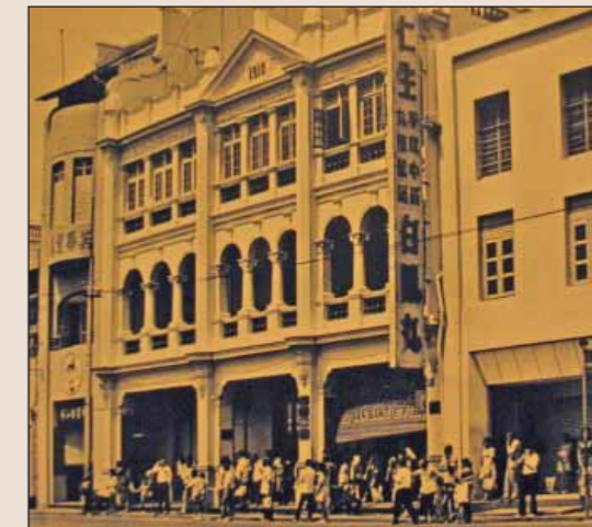
Singapurská stavba z roku 1910

Kmérové povraždili část jeho rodiny, pak s otcem uprchl do Austrálie a před deseti lety přijel se dvěma tisíci dolarů do Lvího Města. Dnes mu patří několik luxusních restaurací. Nejen Super Strom, ale třeba i Merlion na menším ostrově Sentosa, kam jezdí kabinová lanovka přes záliv. Je to místo s největší koncentrací zábavních parků a kasin... Takové asijské Las Vegas! Dřív se pryť to místo jmenovalo Ostrov smrti.