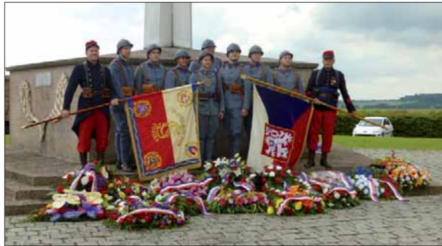
Snímek u pomníku v Darney s bratry ve stejnokrojích účastníků se vzpomínkové pouti

Cesta byla využita i k revizi a upřesnění údajů, týkajících se válečných hrobů s ostatky československých dobrovolníků, a rovněž k zaměření a zjištění stavu některých zákopů, z nichž – nebo na které – Čechoslováci útočili.