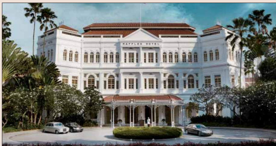
Hotel Raffles Singapore dnes