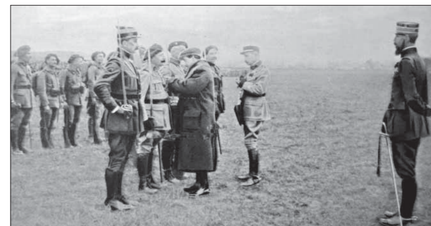
E. Beneš vyznamenává čs. válečným křížem čs. vojáky, 1918

Oba československé pluky se po stažení z fronty u Vouziers a Terronu přesunovaly k Mourmelonu. Počátkem listopadu 1918 dorazila Čs. brigáda se značně prodláženými řadami do St. Pierre a Arne. Jednotlivé prapory byly doplněny novými čs. dobrovolníky. Dne 8. 11. 1918 vykonala brigáda přehlídku za účasti ministra zahraničí nově vzniklého Československa E. Beneše. Při této příležitosti bylo velitelem armády několik desítek důstojníků a vojáků brigády vyznamenáno fr. válečným křížem a dalšími vysokými vyznamenáními. ■