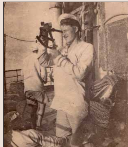
Děda námořník a sextant