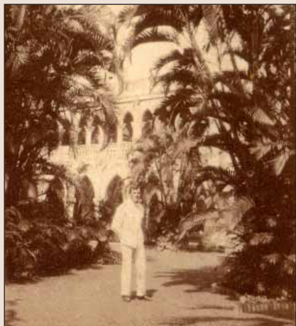
Tropický prales, jak jej viděl děda Jaromír, už dnes v Singapuru nenajdete.