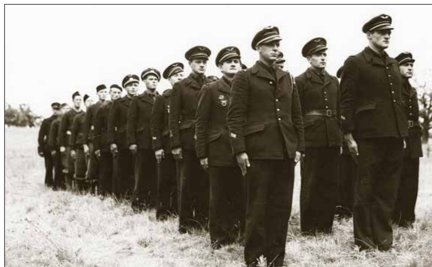
Nástup čs. letců ve Velké Británii ještě ve francouzských stejnokrojích

spojenců. Prvního srpna 1940 vydali Němci směrnicí č. 17 o vedení letecké a námořní války, která ukládala zničit RAF a britský letecký průmysl, rozvrátit zásobování Velké Británie potravinami a způsobit co největší ztráty britskému obchodnímu a válečnému loďstvu. K dalším významným datům této bitvy patří 13. srpen (tzv. Eagle Day), kdy Luftwaffe zahájila všestranné útoky. Ty se ale neobešly bez katastrofálních ztrát střemhlavých bombardérů.