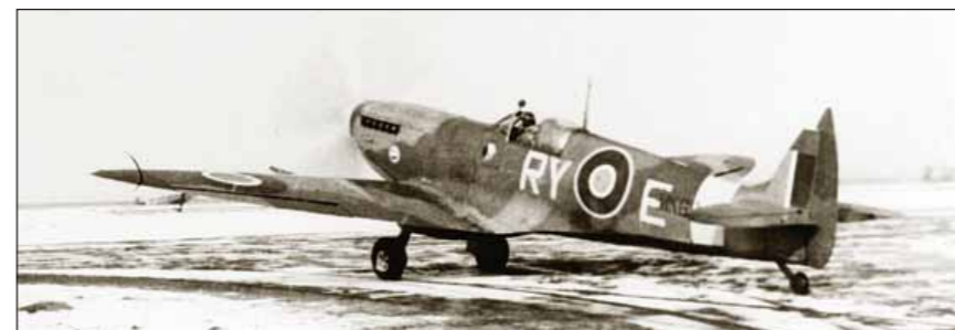
Čs. stíhací wing po zařazení do vzdušné obrany Velké Británie

Britové také na rozdíl od Němců dokázali poměrně úspěšně zapojit do systému včasné výstrahy radar. Navíc měli k dispozici širokou síť pozorovatelů, která hlásila německé formace okamžitě po překročení pobřeží. Boj o informace vyhrávali i v oblasti rádiového zpravodajství. Kromě cenných poznatků pocházejících z rozluštní německých depeší šifrovaných přístrojem Enigma se jednalo o informace získané sledováním rádiového provozu bombardérů Luftwaffe.