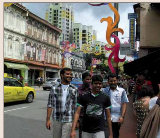
V ulicích města