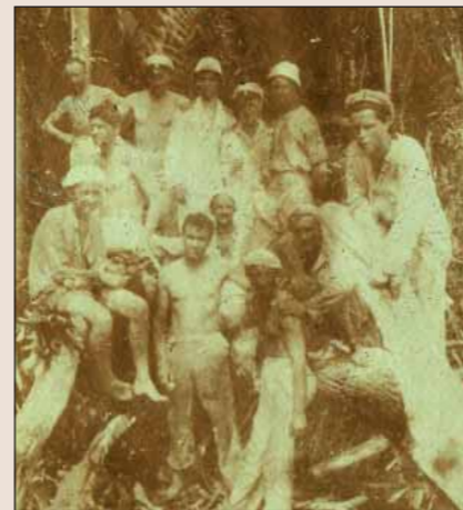
Evropané museli před sto lety chodit v bílém.