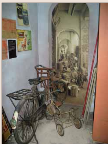
Muzeum Chinatown Heritage Centre

Pochválov, Československo, 24. prosince 1920 ■