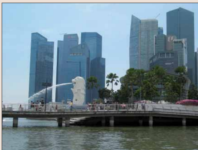
Merlion, vodní lev, je oficiálním symbolem Singapuru.

Opravdovou džungli už v Singapuru nenajdete. Jen umělou ve vstupních halách hotelů, atriích obchodních domů či kolem umělé hory pod poklopem v Gardens by the Bay, kde je džungle schovaná pod kopulemi staveb, nazvaných Flower dom a Forest Cloud. Singapur je totiž výhradně městský stát s mnoha parky, ale bez divoké přírody. Z ostrova se stala bohatá země, vyhlášené centrum obchodu, kde každá světová banka má své zastoupení.