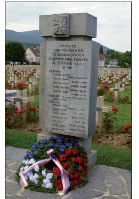
Společný pomník čs. legionářům na vojenském hřbitově v Cernay

Ve čtvrtek 4. července, poslední den vzpomínkové poutě, čekala její účastníky prohlídka muzea v Neuville Saint Vaast [nevil sen va], které bylo doslova napěchováno exponáty – mezi nejzáčasnější pochopitelně patřil originál kompletního válečného stejnokroje čs.