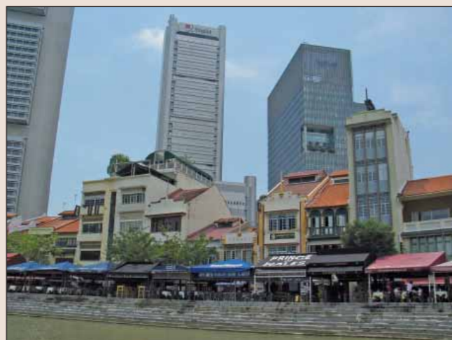
Nábřeží v Singapuru