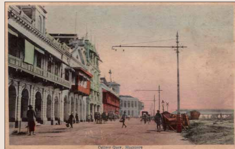
Singapur Collyer Quay v roce 1920, dnes už vede středem města.