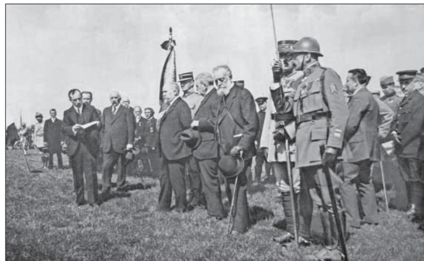
Prísaha Čs. brigády, Darney 30. 6. 1918

V polovině října 1918 byla Čs. střelecká brigáda soustředěna v Argonách, v oblasti Vouziers, spolu s celou fr. 53. pěší divizí a 106. fr. pěší brigádou. Průzkumem bylo zjištěno, že proti nim stojí dvě německé divize (pruská