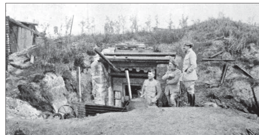
Velitelství 1. kul. roty 21. stř. pluku, Hermonville, 1918

Brzy ráno následujícího dne soustředili Němci na Terron silnou dělostřelbu. Celá obec byla plná výbuchů, létajících střepin granátů a dýmu.