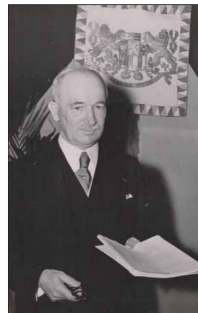
Vrchní velitel čs. branné moci a prezident republiky prof. PhDr. et JUDr. Edvard Beneš na oficiálním portrétu z let 2. světové války