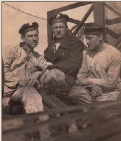
Děda námořník s kamarády na lodi Ore