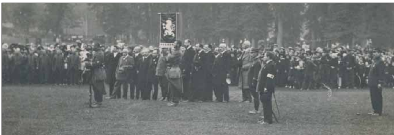
Slavnostní ceremonie dne 12. října 1915, kdy rota „Nazdar“ obdržela rotní praporek.