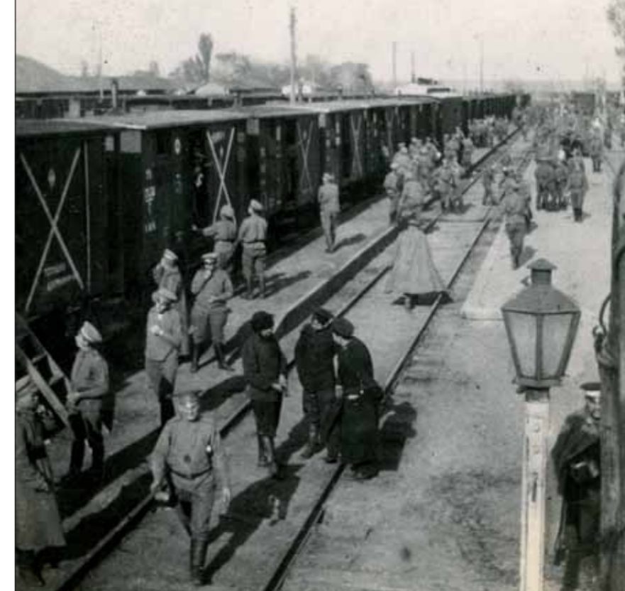
Kyjevské nákladové nádraží, odkud 21. října 1914 odjeli příslušníci České družiny na frontu.

převahu nad Petrohradem. Při kyjevské skupině vznikl Sbor spolupracovníků, který ve svých kartotékách soustřeďoval evidenci o rakousko-uherských zajatcích české a slovenské národnosti a dodával ruskému průmyslu naše odborníky, techniky a dělníky různých profesí, zvláště v oboru strojírenství, hutnictví a chemického průmyslu.