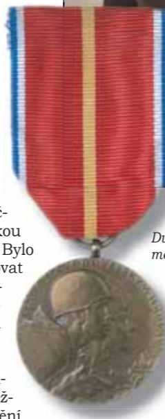
Dukelská pamětní medaile

Slabým osobně organizoval odsun raněných, zejména z prostoru 3. čs. brigády. Po rozvinutí dvou brigádních obvodů a polní chirurgické nemocnice zapojuje do odsunu zraněných i dva slovenské autobusy, které náhodně přejely frontu z území Slovenska. Raněných vojáků je však mnoho a automobily nestačí. Vydává proto rozkaz vyložit munici a jiný materiál, aby odsun raněných urychlil. Ale ani tato kapacita nestačí a je nutné další raněné vozit až na armádní nemocniční základnu, která je vzdálena asi dvacet kilometrů severovýchodně od Krosna.