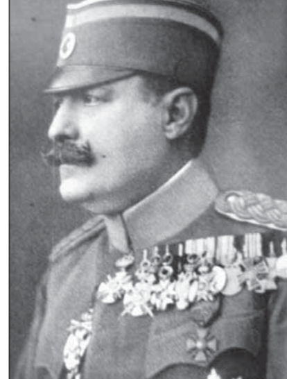
Plukovník Hadžić (focen již jako generál), velitel I. srbské dobr. divize

Avšak ještě před naplněním tohoto povolení začala tehdy silná rakousko-německá ofenzíva, která drtila statečný odpor srbských jednotek. Navíc v říjnu 1915 zaútočila na Srbsko i bulharská armáda, poté co se Bulharsko postavilo v rozhořelém konfliktu I. světové války na stranu R-U a Německa (Bulharsko vstoupilo do války 14. října 1915, zraňuje tak dosavadní přátelské vztahy