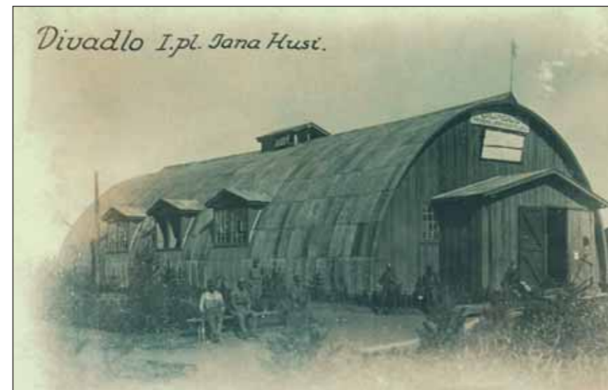
Vojenské divadlo 1. pluku Mistra Jana Husi, Sibir 1918

stran dožijeme se české samostatnosti... Vzpomínáme-li dnes mužů jako Hus, Žižka, Chelčický, Komenský, musíme si uvědomiti, že jako oni bojovali a pracovali pro svobodu českého národa, tak jest i naši povinností pro svobodu svého národa podniknouti vše, co je v naší moci.“