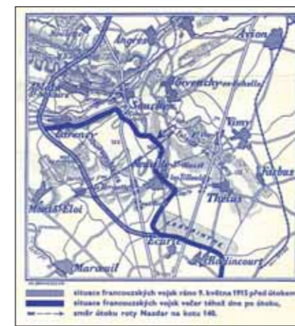
Mapa bojů roty „Nazdar“ ve dnech 9. května a 16. června 1915 u Arrasu