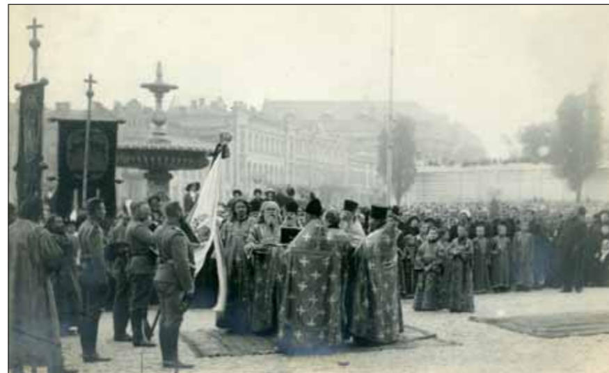
Slavnostní přísaha a svěcení praporu České družiny v Kyjevě 11. října 1914

V Rusku existovala v té době početná česká krajanská obec. Předpokládá se, že dosahovala počtu až 70 000 osob; Slováků bylo podstatně méně – jen asi 600 osob (podle některých zdrojů až kolem 2000 osob). Češi žili převážně na Volyni a v Kyjevě, Slováci ve Varšavě, která tehdy patřila Rusku. Po vyhlášení války Rakousko-Uherska Rusku docházelo mezi krajany k zatýkání, propouštění ze zaměstnání, zabavování majetku, policejnímu dohledu a hrozila jim internace. Již 4. srpna 1914 (podle juliánského kalendáře používaného pravoslavnou církví 22. července) se konaly porady českých a slovenských spolků v Kyjevě. Jejich vedení později vyslala k caru Mikuláši II. deputaci, která žádala o souhlas k založení zvláštní vojenské jednotky. Čeští krajané vytvořili též „Radu Čechů v Rusku“. Již 12. srpna Rusko souhlasilo se zřízením jednotky a náčelník štábu kyjevského okruhu byl pověřen jejím formováním. Měly vzniknout dva pěší pluky s ruskými veliteli (nejméně jedna třetina v každé rotě), jednotka měla ruské uniformy a distinkce, ruské velení, administrativu a ruské předpisy. Tak vznikla „Česká družina“, pro kterou začal nábor dobrovolníků pod heslem: „Za samostatné české království s Romanovcem na trůně“. Náboru pomáhala myšlenka samostatného státu a vlastenecká výchova především v řadách Sokola, který měl mnoho cvičitelů i v Rusku (J. J. Švec a další).