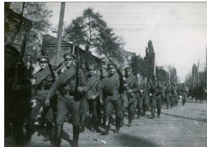
Návrat jedné z rot České družiny z výcviku konaného za městem, říjen 1914