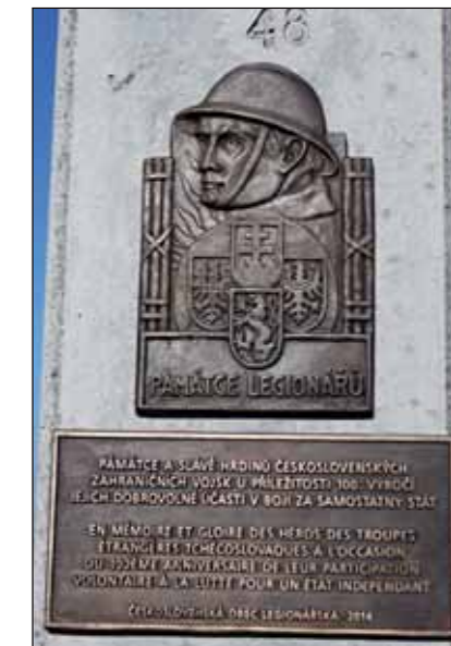
Nová pamětní deska na místě bojového nasazení rotu „Nazdar“ u Ferme des Marquises