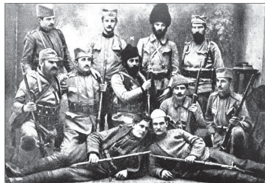
Vojvoda Tankosić se svými četníky (označen vojvoda Tankosić), 1914

Před válkou na území Srbska žilo také množství Čechů. Část těchto krajanů po vypuknutí války vstupovala do srbské armády a dobrovolnických oddílů. Množství Čechů žilo i přímo v Bělehradu, kde se sdružovali v rámci vlasteneckých spolků Lumír a Havlíček. Když vypukla válka a samotný Bělehrad byl před postupující r-u armádou evakuován, uniklo i množství českých krajanů dále do vnitrozemí. Spousta jich však také byla srbskými úřady zatčena a internována, protože se právně jednalo o občany nepřátelského státu (R-U), pokud samozřejmě neměli již srbské občanství. Hned v prvních dnech války desítky českých krajanů u nábořových kanceláří usilovalo o přijetí do srbských jednotek. Kolem 17 Čechů