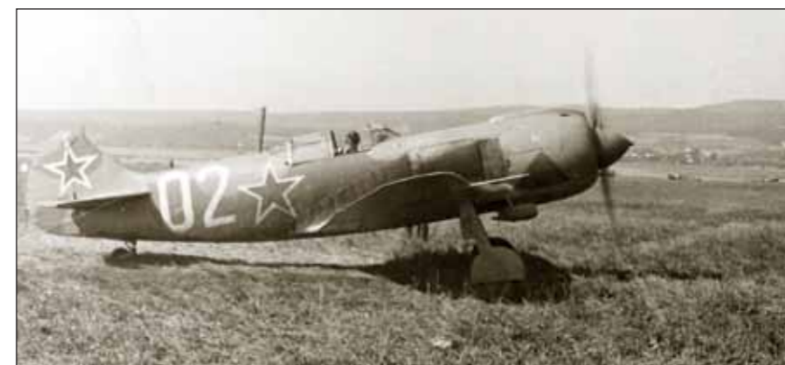
1. čs. stíhací letecký pluk na Slovensku