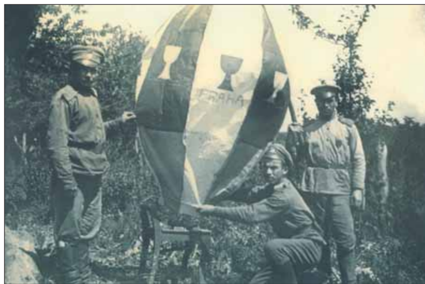
Čečkovy agitační balony, Rusko 1916

neohrozenost a vojenský génius sa priamo ponúkali ako predobrazy veliteľov našich légii. Ale nielen to, išlo aj o myšlienkový odkaz husitskej epochy, ktorá sa podľa Františka Palackého pričini-la o to, že vtedy sa český národ ocitol na čele európskych udalostí. Husitskou ideou bol boj proti nespravodlivosti, za poznanú pravdu až do smrti a obrana proti nepriateľskej cudzine, ktorá sa myšlienky, pri zrode ktorých stál