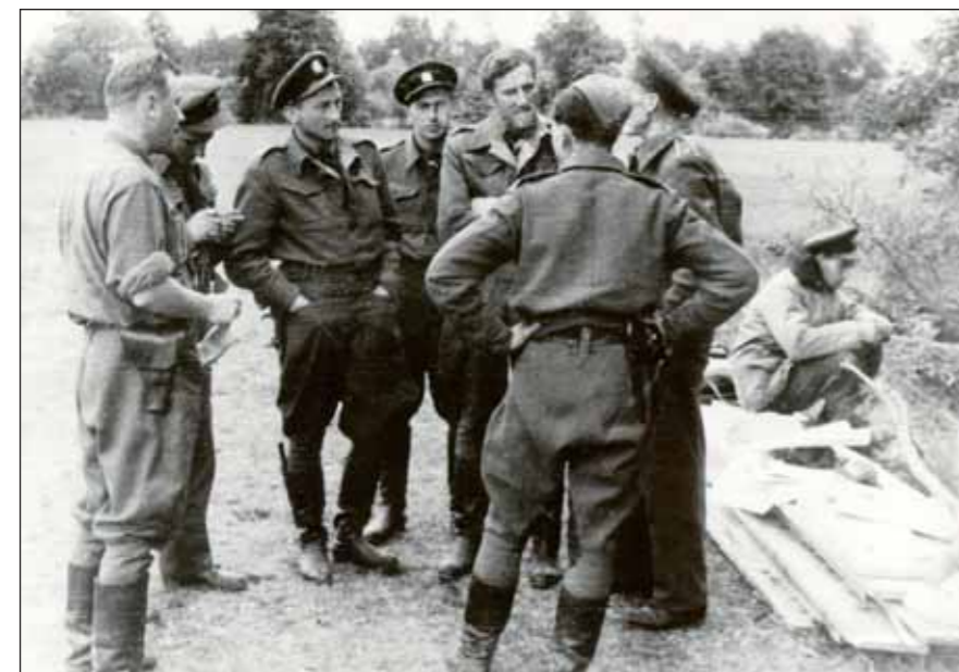
Piloti 1. čs. stíhacího leteckého pluku před startem na první bojový úkol – přepad letiště v Piešťanech 18. 9. 1944

Po dojednání všech detailů přepravy letecké jednotky přistál o dva dny později na povstaleckém území celý pluk. Stal se tak první jednotkou československé