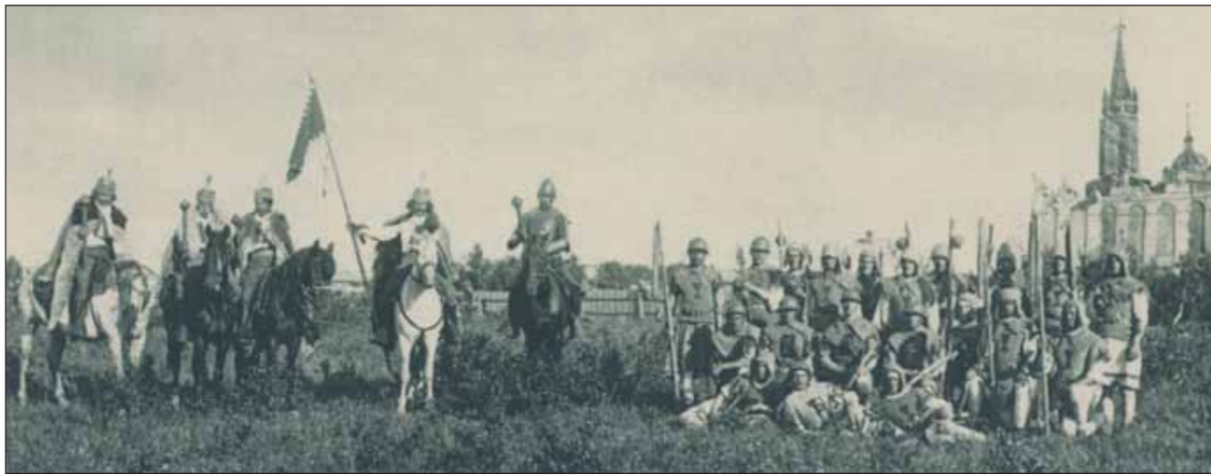
„Husitské vojsko“ při bojové cestě na Sibiř

stotiny 30. pěšého pluku z Vysokého Mýta při obsazení Lučence 2. 1. 1919 poslal Jiráskovi telegram: „Autoru Bratrstva sdělujeme, že Lučenec opět po letech dobyt. Asistenční setnina Vysoké Mýto“ ,čo bola zrejma narážka na Jiráskovu trilógiu „Bratstvo“ najmä na diel „Bitka pri Lučenci.“