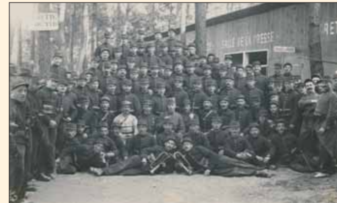
Skupinová fotografie příslušníků 4. roty „Nazdar“ v Bayonne