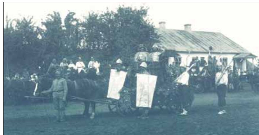
Husitský vůz na slavnosti pořádané československými legionáři, Sibir 1918

V českých dejinách boli v 15. storočí známi vynikajúci vojenský strategovia a úspešní vojvodcovia, predovšetkým Ján Žižka a Prokop Veľký. Ich vzory,