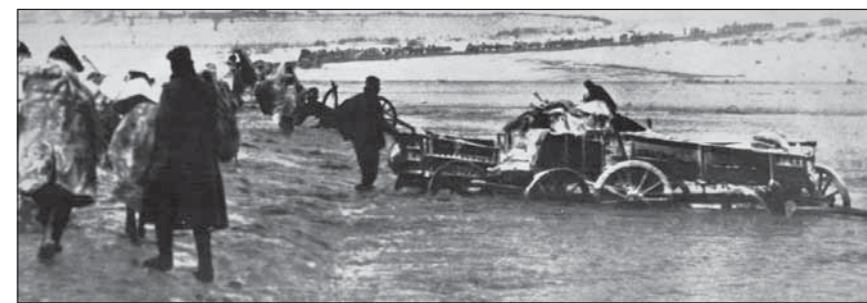
Srbská armáda ustupuje přes albánské hory, 1915

Zbytkům srbského vojska se podařilo nakonec dostat až na jih do Drače (Durrës, Albánie). Zde se srbské