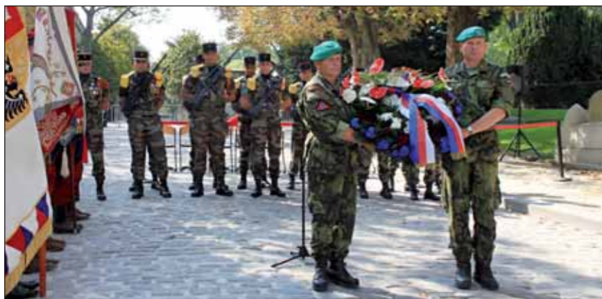
Věnc presidenta republiky nesený účastníky poutě na hřbitově Père LaChaise

vzpomínáme a před jejichž statečností se skláníme. Nezapomeneme-li jejich oběti, bude mezi námi vždy dostatek těch, kteří budou jejich dílo bránit.“