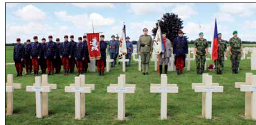
Čestná stráž u hrobů čs. legionářů na válečném hřbitově Le Cheppe

Následoval krátký pietní akt u pomníku bojům roku 1917 u Mont Carnillet a zastavení u hřbitova s padlými polskými, francouzskými a německými vojáky. U Mourmelon-le-Grand jsme si na ruském hřbitově připomněli přítomnost Ruského expedičního sboru, jenž po boku Francie bojoval v první světové válce. Připomeňme, že velitel sboru generál Žilinskij vyznamenal několik