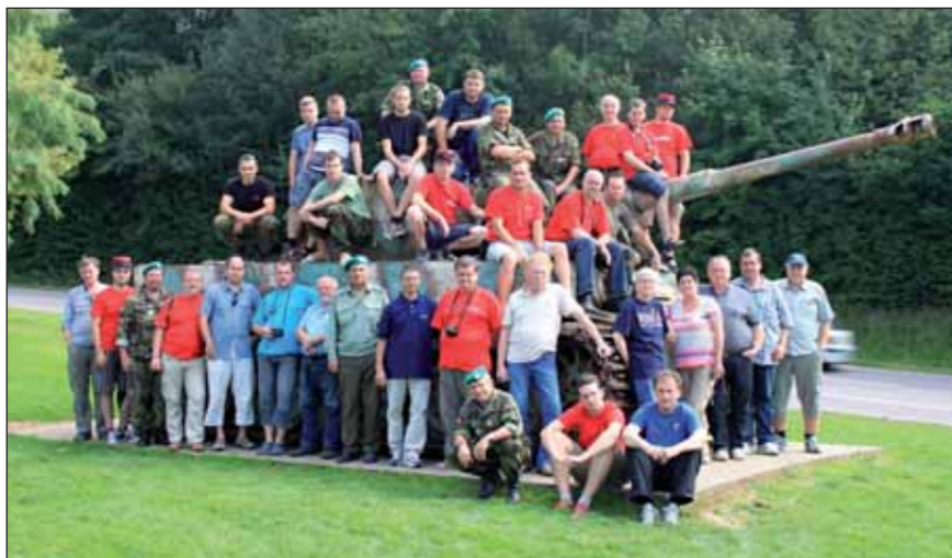
Účastníci „autobusové“ skupiny zcela obklopili německý tank Tiger I u silnice na Vimoutiers.

Poté již se všichni přesunuli krátkým pochodem k bayonnskému pomníku padlým, jenž se nachází na zdi někdejšího bastionu. Tady se nachází česko-francouzská pamětní deska věnovaná slavnostní přísaze příslušníků roty „Nazdar“ dne 12. října 1914. Poté, co k ní byly položeny květinové dary, promluvil k přítomným Petr Gazdík: „Příslušníci roty „Nazdar“ budou vždy z těch, kteří stáli na samém začátku dramatické a oběti vyžadující cesty, na jejímž konci byl vznik humanistického a demokratického Československa. Coby místopředseda Poslanecké sněmovny Parlamentu České republiky mám dnes tu čest zde zastupovat stát, která vzešla z oběti mužů, na které