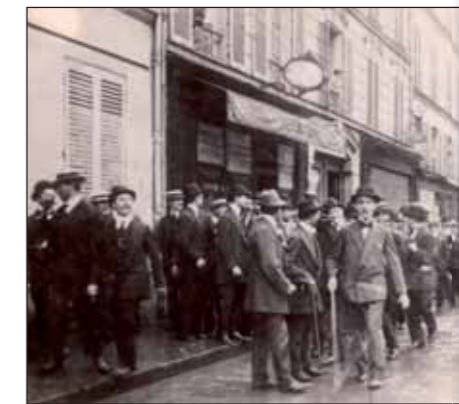
Demonstrace pařížských Čechů před rakouským konzulátem v Paříži v poledne 26. července 1914

křídlové hlíny před komunikací mezi vesnicemi La Targette a Souchez.