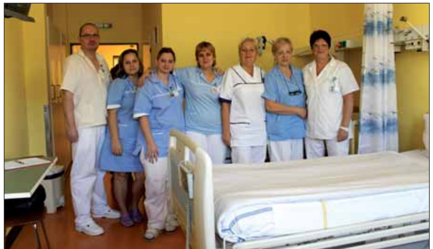
To je tým, kterým se příkladně stará o válečné veterány

Připravil: Miloš Borovička