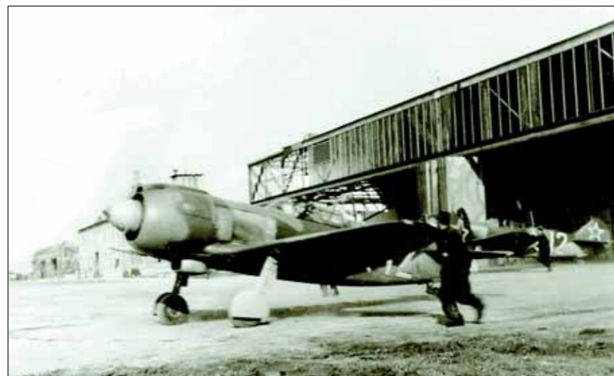
Lavočka 1. čs. stíhacího leteckého pluku v SSSR při startu z letiště Tri duby

Čáslavské základně ho propůjčil u příležitosti osmdesátého třetího výročí vzniku Československa 28. října 2001 prezident České republiky Václav Havel. Základna nese tradici našich stíhacích jednotek nejen z období první republiky, ale především jak na východní, tak i na západní frontě. Organizační jádro 1. čs. samostatného stíhacího leteckého pluku v SSSR, který později získal čestný historický název „Zvolenský“, totiž představovaly dvě desítky pilotů a důstojníků pozemní služby pod velením Františka Fajtla. Tato skupina původně sloužila ve Velké Británii a do Sovětského svazu se přepravila až v únoru 1944. V květnu téhož roku tito letci vytvořili na letišti Ivanovo 128. československou samostatnou stíhací leteckou peruť, která se počátkem následujícího měsíce na letišti Kubinka transformovala na výše zmíněný 1. čs. samostatný stíhací letecký pluk. V té době také piloti dokončili výcvik na sovětských letounech La-5. Počátkem srpna byl pluk v plné bojové pohotovosti, ale pro nedostatek pohonných hmot uskutečnil v následujících týdnech jen minimum