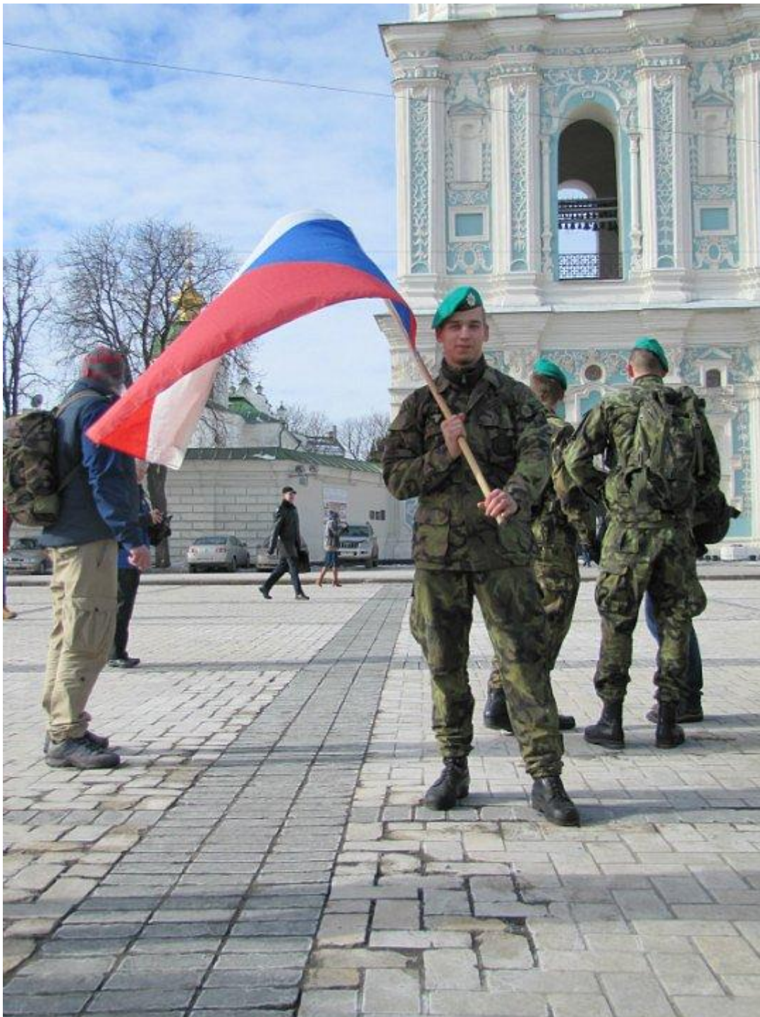
Česká vlajka na Sofijevském náměstí