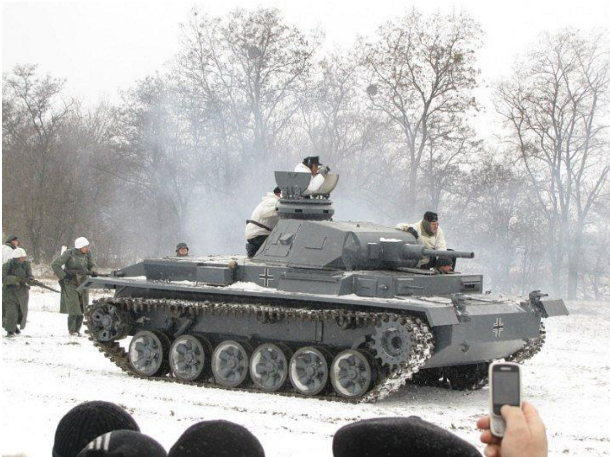
Německý tank T-3 při rekonstrukci boje.

jednotka podpořená tankem T-3 zvítězí, ale postupně přešla aktivita do rukou obránců a vesnici Sokolovo nakonec úspěšně ubránili.