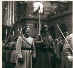
Příchod 21. čs. střeleckého pluku do Prahy v lednu 1919