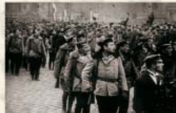
Čs. vojáci rakousko-uherského velitelství, třetí protivojenský čs. archív na území Leopoldské 28. října 1918

Dne 30. října 1918 Slovenská národní rada přijala tzv. Martinskou deklaraci, potvrdila zřízení slovenského území v rámci Československa, 12. listopadu 1918 Americká národní rada územních Řusů v Senatu souhlasila s plánem příjmení Podkarpatské Rusy k Československu a 6. května 1919 svou vládu státní se autonomní součástí Československé republiky vyjádřila v Ústavní Chartě. Rusá národní rada (ČSFR) jako společný orgán národních rad (územních, pravoslaw, a chvostků) zúčastňuje emigrace.