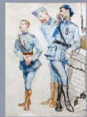
Kupka František, II. světová válka, kolem 1918