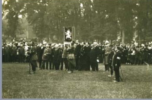
Slavnostní ceremonie na ostrově Camp St. Léon 12. října 1914. Když „Nazdar“ obdržela rotu praporek v Douvres kůň, který vyšly dělní z Bayonne.