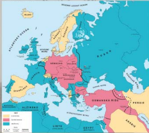
Časový plán bojů 1917

Dohoda vítězů na asijské frontě proš Turcko a německému Asia-Korpus. V Akropolis. Bitvové v úvodu dobyl Bagdad a v Persii a dubnu Dacca, v říjnu Baurou a v prosinci Jeruzalém.