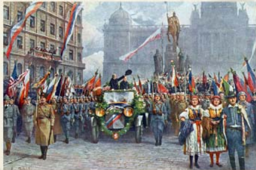
Slavný příchod T. G. Masaryka do Prahy, listopad 1918

zrodili její armády a při zaplácování státních hranic prokázali velmi cenné služby. Do služeb armády nového státu se postavlí řádové také sokolové, skauti a další dobrovolníci. Z domáckých vojenských rakousko-uherských vojsků bylo v itálie postaveno několik desítek praporek domobrany.