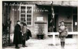
Složení státní na Poštovní bráně

Části a sloužení vojáci se v okamžiku vzniku Československé republiky spontánně přimísili ke své vládě. Př.