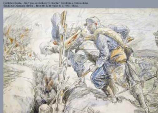
František Kupka, legionář v Itálii, 1918–1919, spolupracovníkem, 1924–1925.