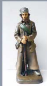
František Kupka byl Otto Gutfreundem, čs. legionářem v Itálii, 1918–1919, spolupracovníkem, 1924–1925.

František Kupka (1878–1947), malíř, žijící v Itálii, byl účastníkem v Francii. V srpnu 1918 byl mobilizován rakousko-uherskou armádou a poslán do italské armády. V květnu 1918 se účastnil bitvy u Amiens, poté emigroval a na frontě se 10. srpna 1918 v Bruselu přidal k legionářům. V listopadu 1918 se stal předsedou legionářské organizace legionářů. V listopadu 1918 se stal členem legionářské organizace legionářů. V listopadu 1918 se stal členem legionářské organizace legionářů.