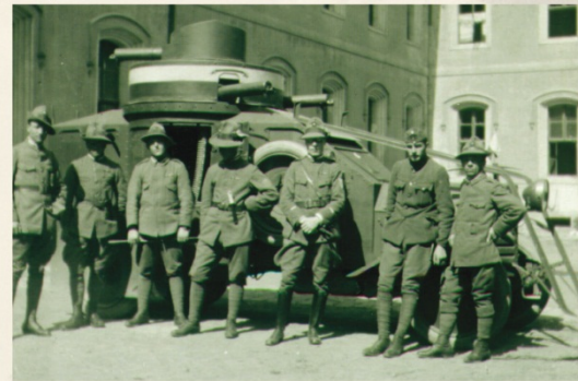
▼ Občerný automobil Lancia čs. legi z řádku v Komárně

Po vzniku Československa si tehdy „rozpínavé“ Polsko nárokovalo území Těšínska, přestože mezinárodně bylo uznáno jako součást Československa. Byly zde i velké zásoby nerostného bohatství. V době války a Maďarskem čs. velení těžko hledalo síly k zabezpečení Těšínska, pro které se nakonec rozhodlo. Po počátečních pokusech o vyjednávání propuky boje v oblasti Bohumína a Karvině 23. 1. 1919. Čs. jednotky si v bojích s počáteční polskou přesilou vedly skvěle. Do 27. 1. 1919 osvobodily čs. území, dobyly Karvinou, Bohumín, Ostravu a Těšín. Otrfšené a překvapené polské jednotky ustoupily nakonec za řeku Vislu. Boje se potom přesunuly na polské území, tvrdé boje proběhly u Kisielowa. K připravovanému velkému útoku na Skoczów již nedošlo na nátlak spojenců Dohody. Dne 31. 1. 1919 bylo uzavřeno příměří a čs. jednotky se následně stáhly zpět na čs. hranici.