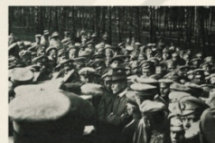
▲ Masaryk mezi čs. legionáři u čs. síť brigád po bitvě u Zborova, 1917

Po únorové revoluci, kdy byl v Rusku svržen car a vlády se ujala „demokratická“ Prozatímní vláda, přicestoval Masaryk do Ruska jako další země Dohody bojující a Německem a Rakousko-Uherskem. Zde podpořil v jednáních s ruskými představiteli možnost vzniku dalších čs. pluků z řad českých a slovenských zajatců. Zejména vítězství Čs. siletecké brigády v bitvě u Zborova v červenci 1917 tehdy jeho jedním dodala silnou podporu před ruskou stranou. Následovalo povolání neomezeného náboru a rychlé výstavby dalších pluků a tím navýšení brigád na dvě a následně brzy na armádní sbor. Do konce roku 1917 se jednalo o sílu cca 60 tis. dobrovolníků, bojujících za čs. samostatnost v Rusku po boku ruské armády.