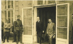
▲ Prezident Masaryk s ministrem Kloufádem, 1918