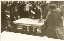
▲ S čs. a spojeneckou generálitou nad plány vojenských manévřů

Důstojník měl velkou odpovědnost – ta se zvyšovala úměrně s větší zastávanou funkcí. Jeho rozhodnutí ovlivňovalo životy desítek, stovek, tisíců lidí. Měl tedy mít proto neustále na paměti, že jediné chybné rozhodnutí může mít velké následky. V případě války měl morální odpovědnost za životy jeho vojáků, kteří padli pro dosažení vojenského cíle. Zároveň však měl být připraven a schopný činit rozhodnutí, často i rychlá a pod časovým či jiným tlakem. Musel být iniciativní, avšak musel se držet zadaných rozkazů.