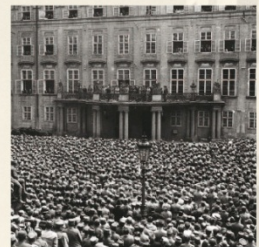
▲ Sjezd legionářů, Pražský Hrad 1924

Zároveň Masaryk rád nosil při nejněžnějších příležitostech oblek armádního střihu bez distinkcí, včetně špicie (stříhem podobné ruské furážce) s bíločervenou stužkou (k připomínce čs. legií), pro kterou se vžil název „masaryčka“.