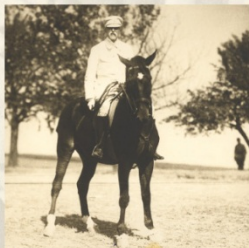
▲ Na koni na vojenských manévřech

Autoritu si důstojník musel umět zasloužit a vypracovat. Jako velitel, jako učitel, jako vychovatel i jako vzor v chování svým podřízeným. Masaryk apeloval na to, že autorita se nedá trvale vynutit ani získávat formou demagogie, že je potřeba si ji zasloužit – navíc v době, kdy i v řadách mužstva je stále větší vzdělanost a není jen nějakou slepou masou. Mužstvo musí zároveň vidět a cítit, že důstojníkovi na něm záleží a že se o něj dokáže postarat. Péče důstojníka o mužstvo měla potom být jeho základní povinností.