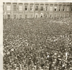
▲ Sjezd legionářů, Pražský Hrad 1924