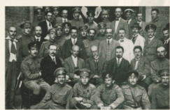
▲ Masaryk u Odbojů čs. národní rady, Kyjev 1917