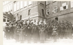
▲ Prezident Masaryk s legionáři k 10. výročí vzniku Československa, 26.10.1928, Praha

Celkově Masaryk vnímal legionáře ve společnosti jako jednu z hlavních opor čs. státnosti a demokracie. Své sympatie a podporu jejich vzdělávacím, sociálním, branným a dalším aktivitám dával často veřejně nejavošněně tak, i jako její člen, podporoval Čs. obec legionářskou, která mezi různými spolkovými organizacemi v Československu měla výjimečné postavení.