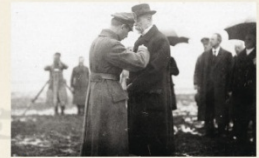
▲ Prezident Masaryk je vyznamenán legionáři-navažky čs. válečnými křížem

Větší vztah Masaryka k legionářům, kteří se v době nejdelší přihlásili k boji za v té době ještě neexistující stát, přetval i po válce do dob tzv. První republiky. Sokolské bratrství a tykáři, přežaté do čs. legií již z organizace Sokol, tak bylo často legionáři užíváno i ve styku s prezidentem Masarykem, což celosvětově byla takřka nevidaná věc, aby někdo prezidenta země oslovoval „Bratře prezidente...“ a tykal mu.