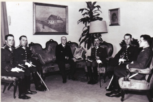
▼ Navštěva důstojníků jezdeckého pluku u prezidenta Masaryka