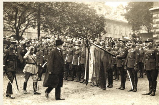
▼ Prezident při přehlička legionářů 1. čs. etfleckého pluku