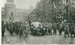
▲ Slavný příjezd T. G. Masaryka Prahou, listopad 1918