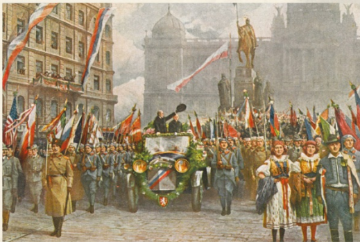
▼ Slavný příjezd T. G. Masaryka Prahou, listopad 1918