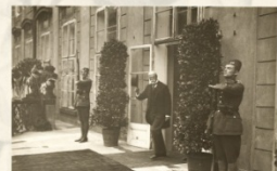
▲ Masaryk na Hradě při setkání legionářů v Praze, 1924

Celkově Masaryk vnímal legionáře ve společnosti jako jednu z hlavních opor čs. státnosti a demokracie. Své sympatie a podporu jejich vzdělávacím, sociálním, branným a dalším aktivitám dával často veřejně nejavošněně tak, i jako její člen, podporoval Čs. obec legionářskou, která mezi různými spolkovými organizacemi v Československu měla výjimečné postavení.