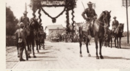
▲ Čs. legiáni z řádku na Těšínsku