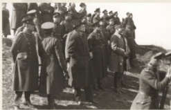
▲ Prezident Masaryk s čs. generálitou na vojenských manévrech ve 23. letech 20. století