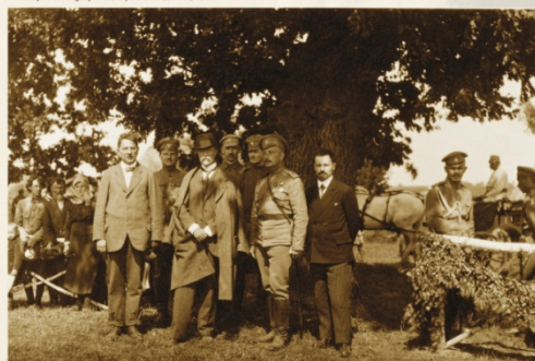
▲ Masaryk u čs. brigád v Rusku po bitvě u Zborova, 1917