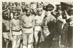
▲ Masaryk mezi čs. legionáři v Rusku po bitvě u Zborova, 1917

Cestou mnohokrát nastříval čs. jednotky i T. G. Masaryk během svého pobytu v Rusku. Byl čs. legionáři vše vítán a uznávan jako milovaný a uznávaný vůdce čs. zahraničního odboje, kterému přímo i nepřímě sdělili projevy věrnosti a loajality. Čs. dobrovolníci (legionáři) ho oslovovali často „tatíček Masaryk“. Sám Masaryk byl loajalitou čs. legionářů dojatý a jeho přístup k nim měl skutečně velmi blízko k utváření „otcovského“ přístupu. Ruská strana mu prokazovala úcty jako prezidentovi, přestože Československo ještě neexistovalo. Masaryk se uslovně věnoval i organizační práci k podpoře existence a výstavby Čs. armádního sboru. V průběhu pobytu v bouřlivém ruském prostředí měl Masaryk i svou vlastní osobní stráž složenou z vybraných čs. dobrovolníků. Zajímavostí následně rovněž bylo i to, že jméno Masaryka převzal do svého čestného názvu 5. čs. stř. pluk.