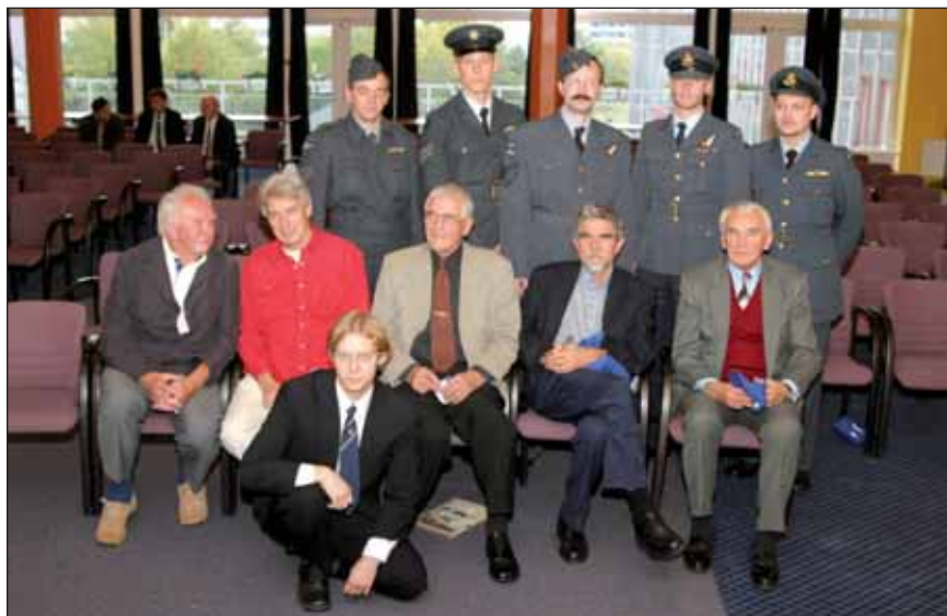
Fotografie ze setkání tvůrců a herců filmu Nebeští jezdci a bývalých příslušníků RAF s veřejností, hotel DUO, 25. 9. 2004