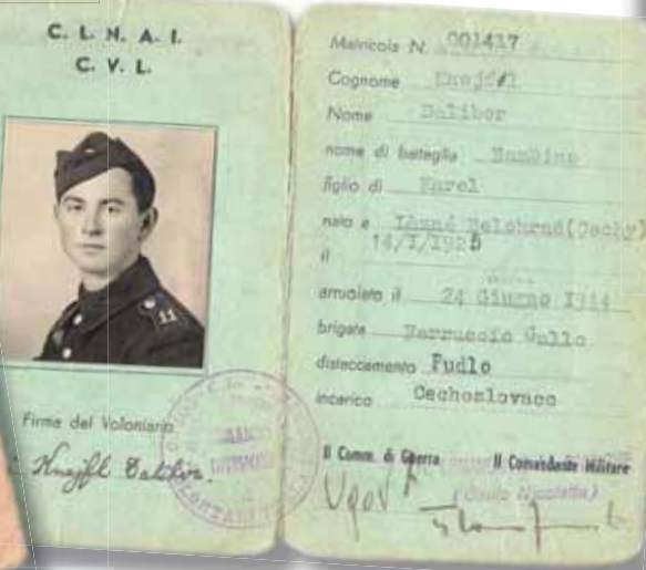
Průkazy potvrzující partyzánskou činnost