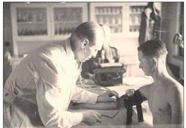
Příchod nováčků do kasáren 5. 10. 1943, lékařská prohlídka