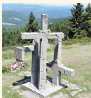
Památník Tři kříže