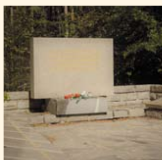
Památník obětem salašského masakru