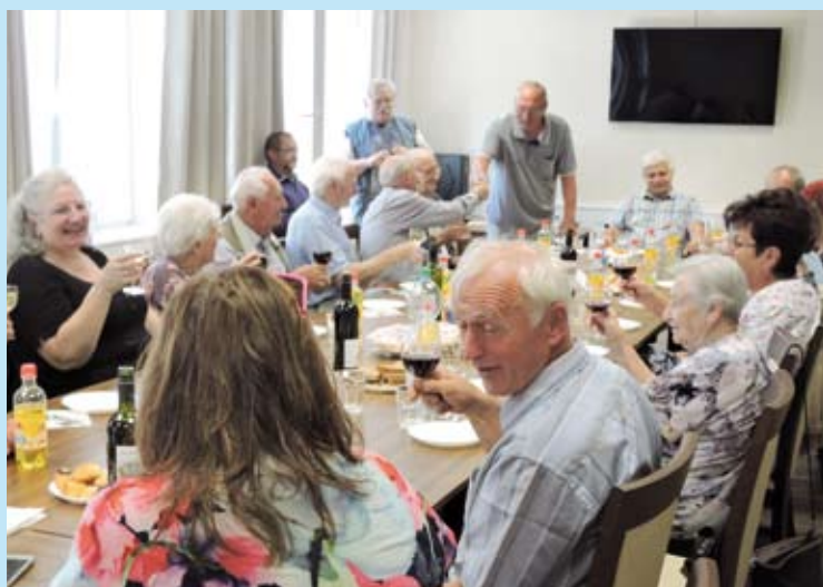
Slavnostní přípitek pro jubilující válečné veterány

umožní, kvituje s povděkem, že do salonku Komunitního centra v Brně mají bezbariérový přístup, včetně plošiny pro vozíčkáře. Bez tohoto vybavení bychom naše nejstarší veterány vůbec zvat nemohli.