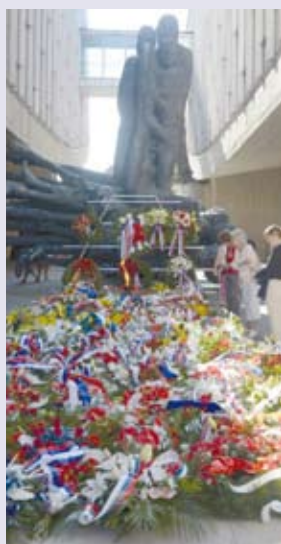
Památník SNP v Banské Bystrici