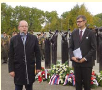
Slavnostní otevření památníku za účasti předsedy vlády