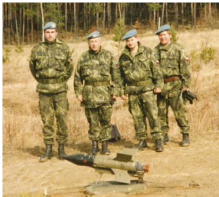
Příprava na misi probíhala ve výcvikovém středisku v Českém Krumlově