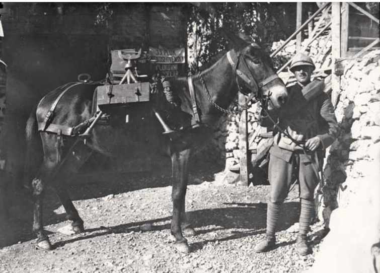
Mula, cenný pomocník v horském terénu, s podstavcem a skřínkami na střelivo pro bombomet 33. čs. stř. pluku.

v krvi. Obě strany ztratily na 30 tisíc padlých, nezvěstných, zajatých a raněných. Pěší pluk č. 11 byl téměř zničen, když přišel o více jak 3000 mužů, zbylá necelá pětistovka však dokázala ubránit svá postavení a italské vojáky odrazit.