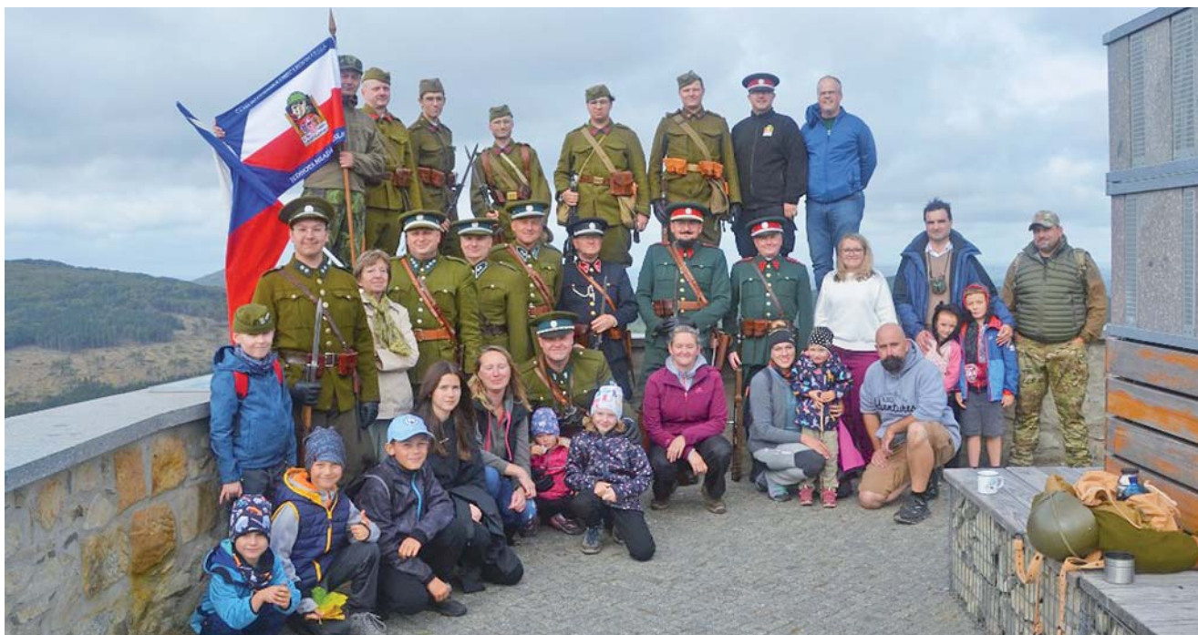
Společný snímek na vrcholu Luže

Poděkování patří všem návštěvníkům a Ministerstvu obrany ČR za dlouholetou podporu akce. Děkujeme a těšíme se na shledání zase za rok. ■