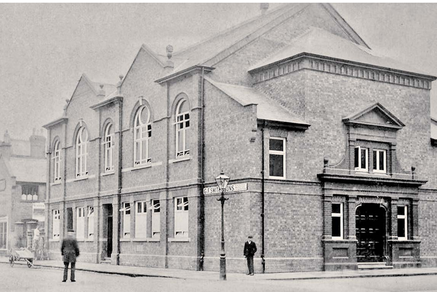
Urquhart Hall v Leamington Spa