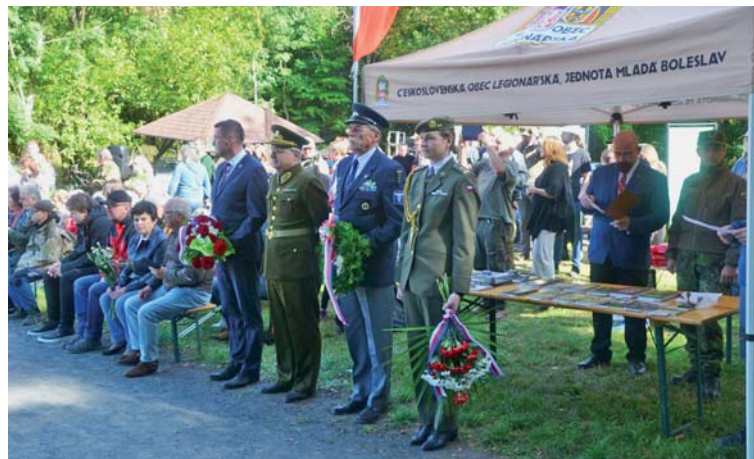
Vzácní hosté před začátkem vzpomínkového aktu.

Samotný vzpomínkový ceremoniál začal za příjemného podzimního počasí ve 14 hodin u pomníku hraničářů na hraničním přechodu Dolní Světlá – Waltersdorf. Zde v září roku 1938 proběhl boj o československý celní úřad mezi Stráží obrany státu a teroristy sudetoněmeckého Freikorpsu. Důstojnou kulisu celé vzpomínky tvořili opět nejen dobově oděni příslušníci finanční stráže, armády, četnictva a policie, ale také příslušníci Čestné jednotky Policie České republiky z Liberce a vojáci z Krajského vojenského velitelství Liberec.