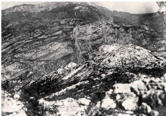
Pohled na Doss Alto (vpravo uprostřed) od Sasso Legg, vlevo postavení Roncola italiana.

Úsek Altissimo se rozkládal od severního cípu Gardského jezera až k městečku Brentonice a byl jedním z nejdůležitějších bodů fronty italské 1. armády. Chránil masiv Monte Balda proti nepřátelskému útoku a zároveň s linií od Zugny Torty