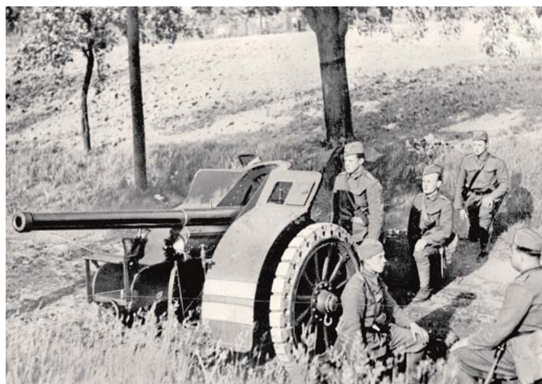
V roce 1938 tvořily výzbroj dělostřeleckého pluku 54 „motorisované“ 8cm lehké kanony vz. 30 a 10cm lehké houfnice vz. 30. Na ilustračním snímku zbraň prvního typu.

Následně se rozhodl pokračovat v kariéře u armády. V srpnu 1919 byl přidělen k referátu pěchoty na MNO a v listopadu 1920 na zkušební praxi k dělostřeleckému pluku 104 v Hradci