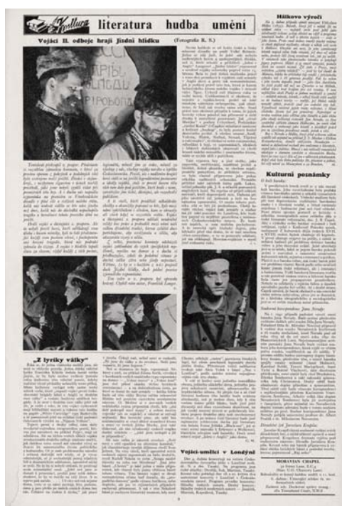
Vydání Čechoslováka ze 4. dubna 1941 reportující o inscenaci Jízdní hlídky

Publikace „Můzy v exilu“ o kulturních aktivitách v období 2. světové války uvádí, že v roce 1941 vojáci-divadelní ochotníci ze 2. pěšího praporu sehráli dvě představení Jízdní hlídky ve Walton Hall. Po sobotní premiéře dne 15. března následovala další představení, v nichž se připomínalo hrdinství a soudržnost Čechů a Slováků, kteří neuhýbají před povinnostmi a nevzdávají se ani tváří