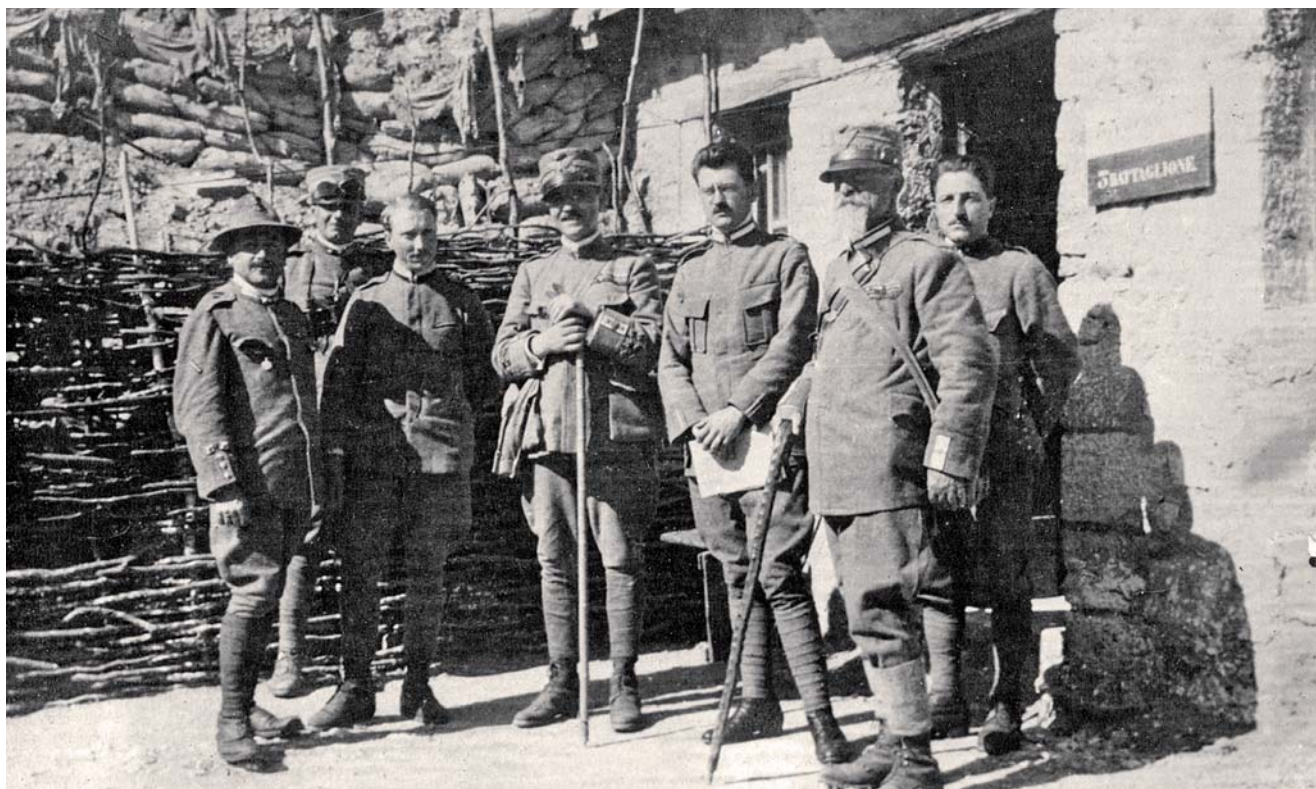
Generál Graziani a generál Badoglio při inspekci 3. roty 33. čs. stř. pluku na Doss Alto.

úzkou rokli, kterou procházela jediná silnice k nepřátelským postavením. Pozice byla také dobře vybudována, rozsáhlý tunel se točil v půloblouce kopulí a útočiště v něm našlo několik rot a kulometů. Před úkrytem se ještě nalézala předsunutá hlídka Roncola italiana, nejnebezpečnější místo celých čs. linií (měla přezdívku šibenice). Nepřekvapivě tak Doss Alto během bojů několikrát změnilo majitele a nebylo mezi vojáky oblíbené. Tušili, že v případě nepřátelského útoku buď padnou, nebo budou zajati a čeká je oprátka. Uvědomovali si však význam postavení.