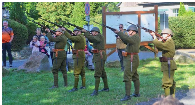
Čestná salva za padlé