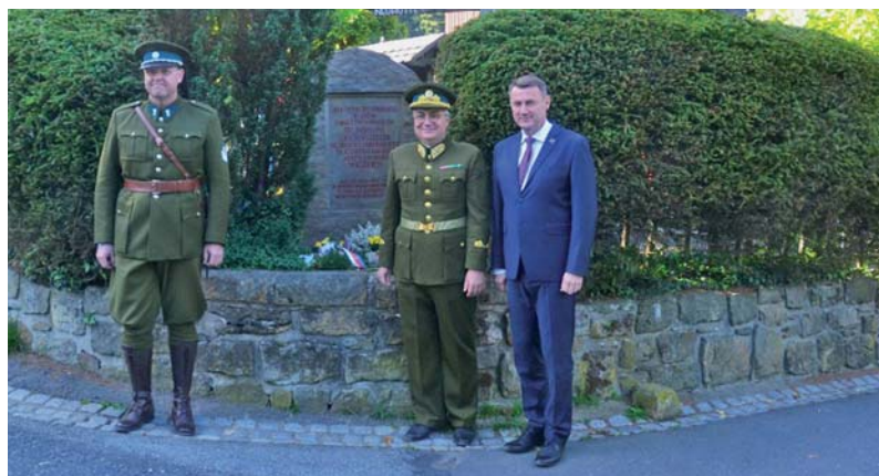
Pomník čs. hraničářů po skončení pietního aktu