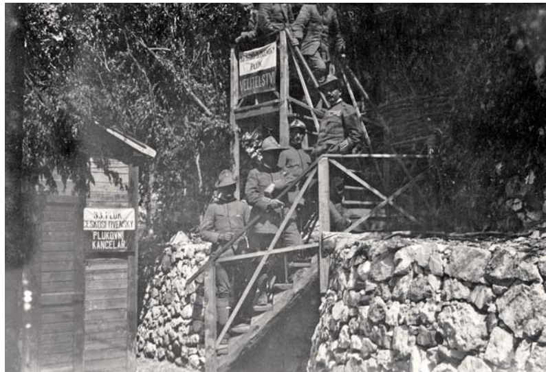
Velitelství 33. čs. stř. pluku mezi Doss Casina a Doss Remit.

k Pasubiu uzavíral nepříteli vstup do lombardské nížiny údolím Adiže. Na frontě zaměnily čs. jednotky 13. a 17. skupinu alpských praporů.