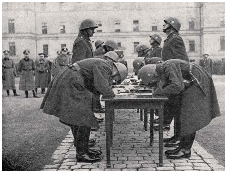
Nováčkové I. praporu Vládního vojska podepisují slavnostní slib.