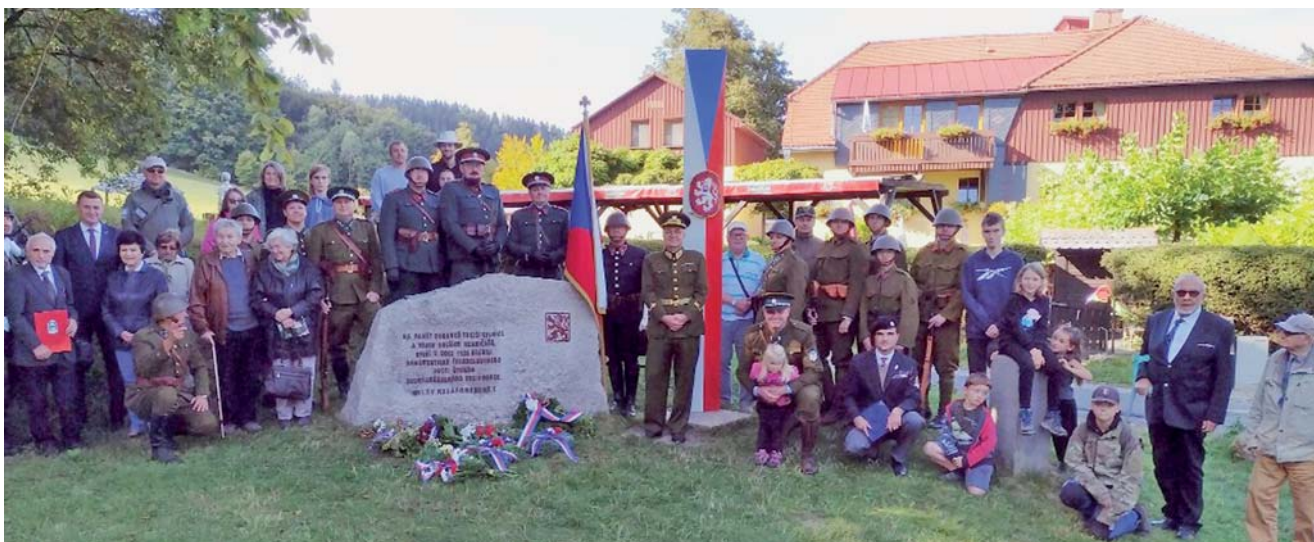
Společný snímek po ukončení vzpomínkového aktu