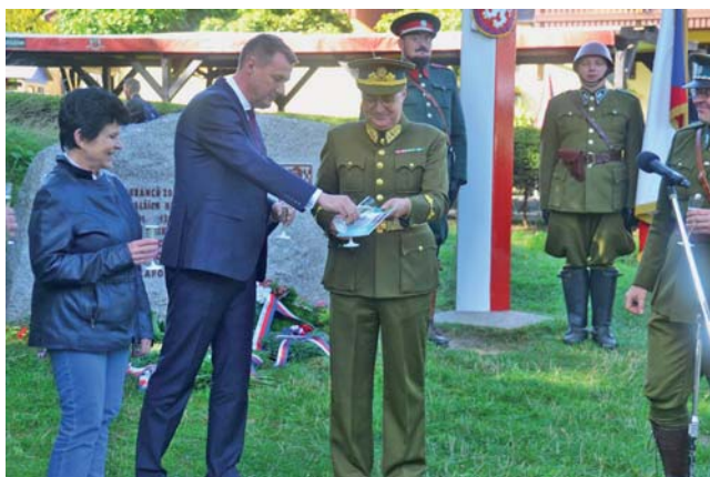
Křest nové knihy Celní úřad Horní Světlá