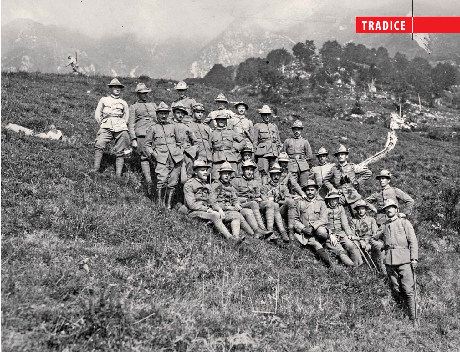
Důstojníci III. praporu 33. čs. stř. pluku na Mt. Baldo. Na snímku jsou také oba důstojníci padlí na Doss Alto – č. 1 por. Oldřich Trojánek, č. 3 por. František Svoboda. Jindřich Varhaník sedí napravo od Trojánka.

na Doss Alto, na který začali házet bomby a vchodem se snažili vniknout dovnitř.