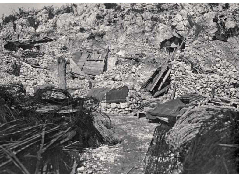
Zákopy a místo stráže a pozorovatele Roncola italiana pod kótou 703.

Útok začal 21. září asi ve 4 hodiny ráno silnou dělostřeleckou palbou. Italové sice vzápětí odpověděli, rakousko-uherský útočný prapor Riva se ale již přesunul před drátěné překážky, takže nebyl zasažen. Zato rakouské granáty dopadaly ve velkém počtu jak na úkryt, tak na pozorovatelnou Roncola, křídla kóty 703 pak byla ostřelována plynovými granáty, aby byl zamezen přísun posil. Rakouská dělostřelba skončila v 5.50 hod. a podařilo se jí zcela zničit drátěné překážky, maskování i část zákopů, načež vyrazily tři nepřátelské útočné skupiny. Postavení Roncola padlo pod nepřátelským nápořem poměrně rychle, několika vojákům se sice podařilo ustoupit na Doss Alto, většina však zahynula a několik bylo i zajato. Velitel postavení por. Oldřich Trojánek se raději zastřelil, aby se vyhnul potupné popravě. Rakušané se tak rychle dostali ke krytu