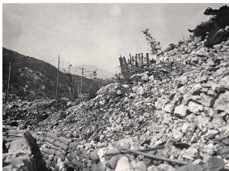
„Zákop smrti“ na Roncola italiana. Pozice hájené kulometnou rotou 33. čs. stř. pluku.