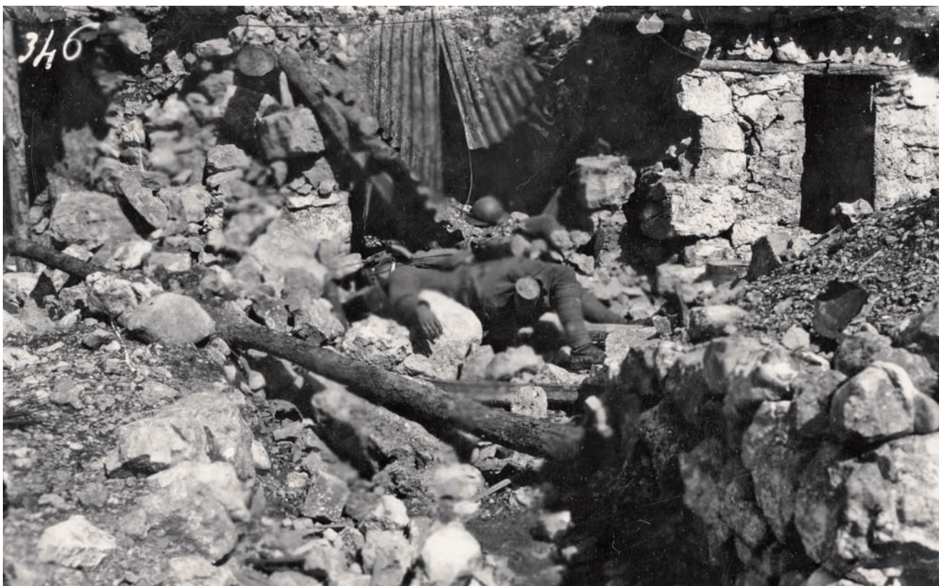
Padlý čs. legionář u vchodu do kaverny na Doss Altu.

byla ve vašich rukou čest národní armády, byli jste všichni jako z kamene; někteří z vás padli na bojišti a několik desítek bylo raněno, ale nepřítel s těžkými ztrátami a s pěnou vzteku u úst se naučil vás znáti v novém národním stejnokroji. Vám, jako velitel a otec, vyslovuji uznání; vám, jako italský generál vyjadřuji obdiv a vděk za významný úspěch, že jste neochvějně obhájili životní bod naší fronty. Všem italskému dělostřelectvu, které s největší pohotovostí a přesností zasáhlo účinně do boje k naší pomoci, posílám svou pochvalu a dík. Celému našemu československému sboru přeji zdar a pevně věřím, že všichni a vždy budeme bojovat stejně udatně a šťastně."