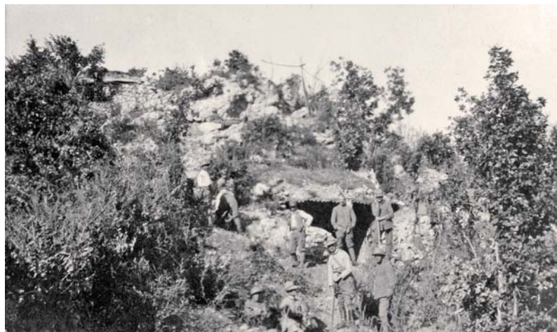
Vstup do kaverny pod kótou 703 Doss Alto.

Důležitým postavením v čs. liniích byla kóta 703 Doss Alto. Byla klínovitě vsunuta do linie a z ní ovládaly kulometry celou